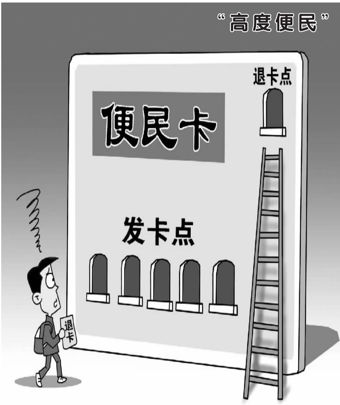
朱慧卿作 新华社发

总之，对外资银行套现既无须大惊小怪、过度解读，也不可完全无视。若能重视这一现象背后的信号，对国有商业银行而言，未尝不是一件“焉知祸福”的事。