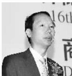
中国银监会监管四部主任 沈晓明

目前，中国政府正在加快推进金融体制改革，推动金融机构加大对实体经济的支持力度，作为中国普惠金融的先行者，我们希望中国邮政储蓄银行继续探索，大胆创新，在推动普惠金融发展方面发挥更重要的作用。要积极探索解决各类群体尤其是弱势群体金融服务的可获得性问题，同时加大普惠金融产品、市场、机构、流程、系统、制度等创新，提升服务水平和商业可持续发展能力。