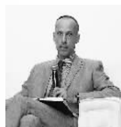
亚洲开发银行经济学部主管 尤尔根·康莱德

普惠金融在全球已是一个非常流行的概念。中国邮政储蓄银行拥有3.9万多个网点，客户达到4亿之多，对金融普惠有极大的促进作用。