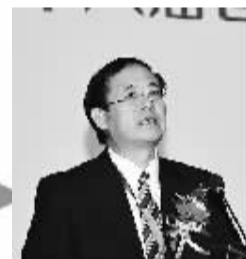
中国人民银行副行长 刘士余

中国邮政储蓄银行有两个系统重要性。一是金融稳定当中的系统重要性。从金融领域角度讲，中国邮政储蓄银行网点规模最大、资产规模位居第七位、居民个人账户数量庞大、县域地区的网点覆盖率已超过98%，因此中国邮政储蓄银行的经营状况、资产质量、流动性管理等，直接关系到中国金融稳定的大局，具备金融稳定当中的系统重要性。二是促进包容性增长方面的服务重要性。中国邮政储蓄银行坚持用商业可持续发展的理念和原则推动包容性金融的增长。一直在发挥自身的传统优势，立足于服务城乡居民和小微企业，在县以下地区的网络中有举足轻重的地位，在中国具有促进包容性增长方面的服务重要性。