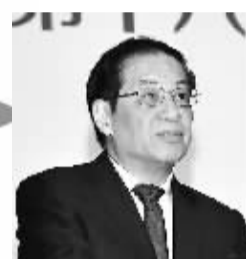
全国政协经济委员会副主任、中国银监会原主席 刘明康

走好一条商业可持续的普惠金融道路需注意三点：第一，改革是根本；第二，认清邮储银行的优势和历史是关键；第三，真正做好商业可持续的普惠金融及吸收新鲜血液是动力。