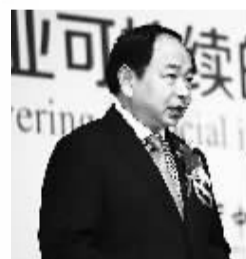
中国邮政储蓄银行董事长 李国华

如何能够更好地运用科技成果，发挥实体网络优势，把握时代脉搏，做好普惠金融服务，是需要思考和解决的课题，也是全球邮政储蓄银行共同面临的全新课题。