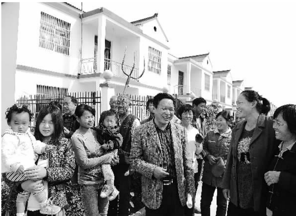
安徽蒙城县乐土镇双龙村大力发展蔬菜种植业，随着农民收入的增加，村容村貌也有了翻天覆地的变化，昔日贫穷落后的小村庄如今已成为远近闻名的“示范村”。