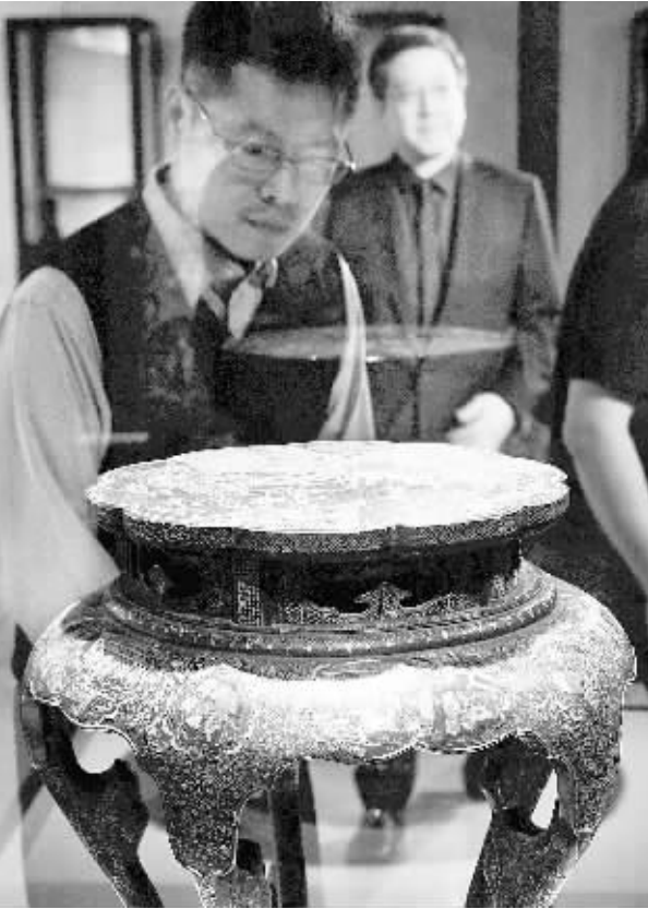
10月11日，人们在螺钿漆器展上参观“黑漆嵌螺钿楼台人物泛舟图五足桌”。当日，“光华可赏——螺钿漆器展”在台北历史博物馆正式开幕。

本报讯 记者杨阳腾报道：由深港百余名民营企业家长共同发起的同心慈善基金会日前正式启动。据悉，基金会已筹集公益慈善资金超1.7亿元。 据介绍，同心慈善基金会是依托深港知名企业建立的面向全社会的公益慈善基金会。现有的百名理事成员均为深港工商界知名人士，包括上市公司74家、全国知名品牌20个，资产规模达1.5万亿元。