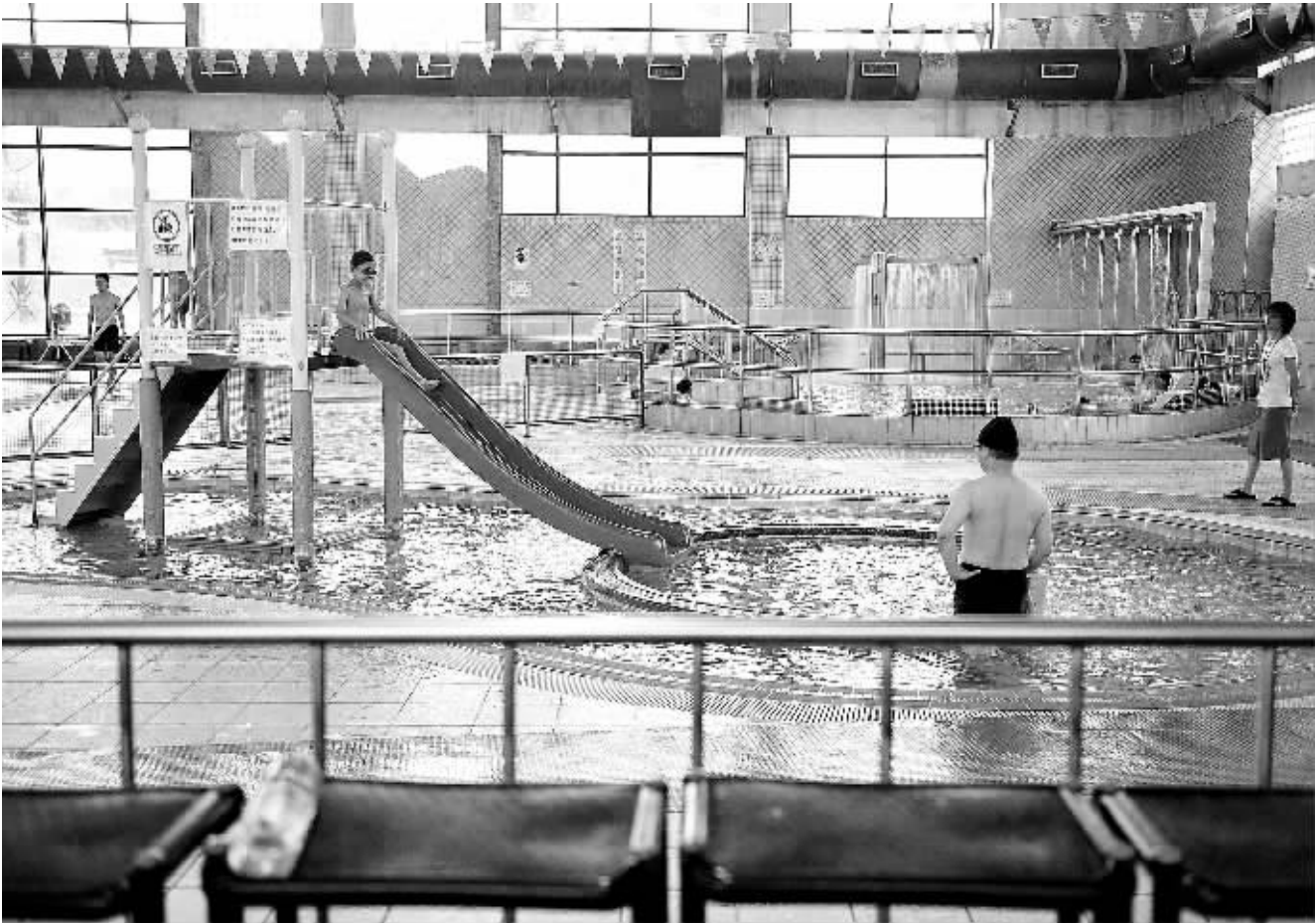
市民在台北北投垃圾焚化厂厂区内的回馈设施“温水游泳池”内休闲戏水(8月30日摄)。台湾垃圾处理经历了露天堆放、卫生掩埋和焚化三个阶段，目前，台湾有24座大型现代化垃圾焚化厂，台北有3座。