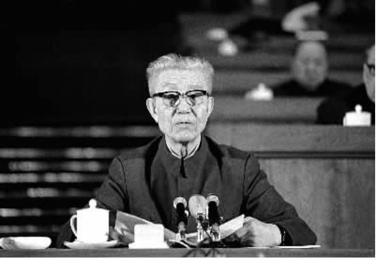
1985年4月3日,郑天翔同志在六届全国人大三次会议第三次全体会议上作最高人民法院工作报告。新华社发