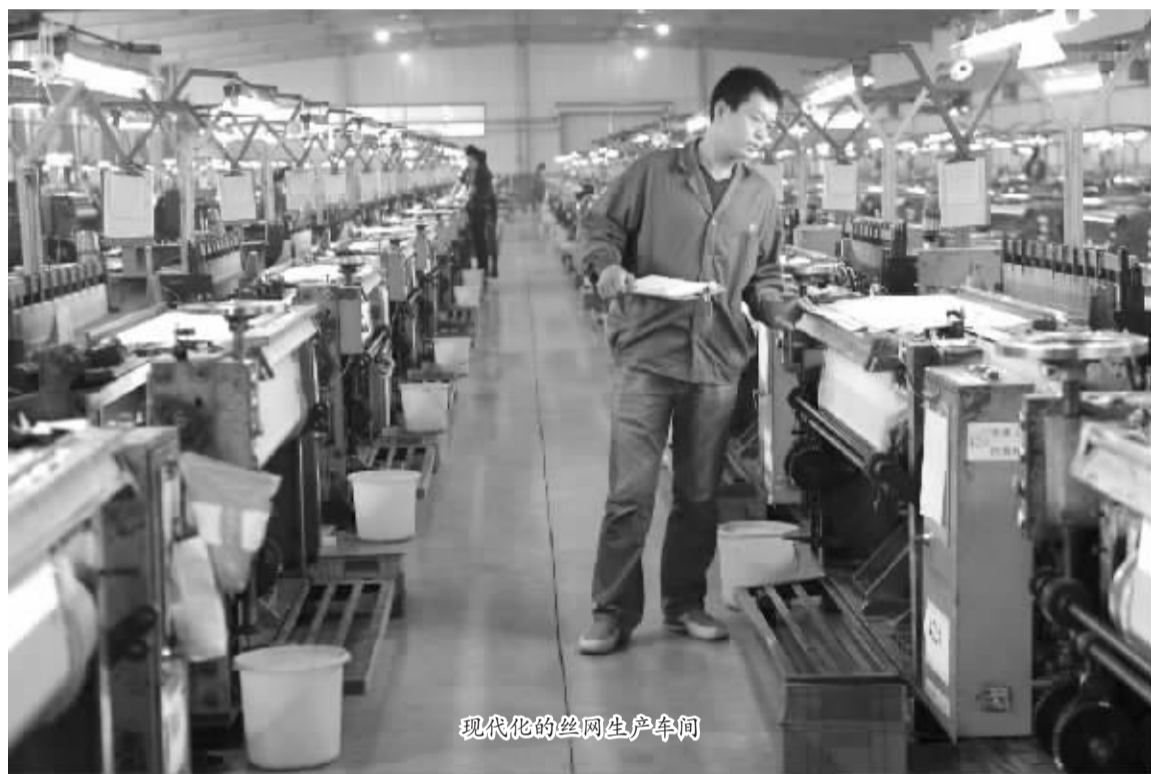
现代化的丝网生产车间

始于明弘治年间的安平丝网产业,近年发展迅猛。其丝网门类之全,规模之大,产量之高,均居全国首位。安平已成为中国著名的丝网生产出口集散地、世界瞩目的丝网产业之城。