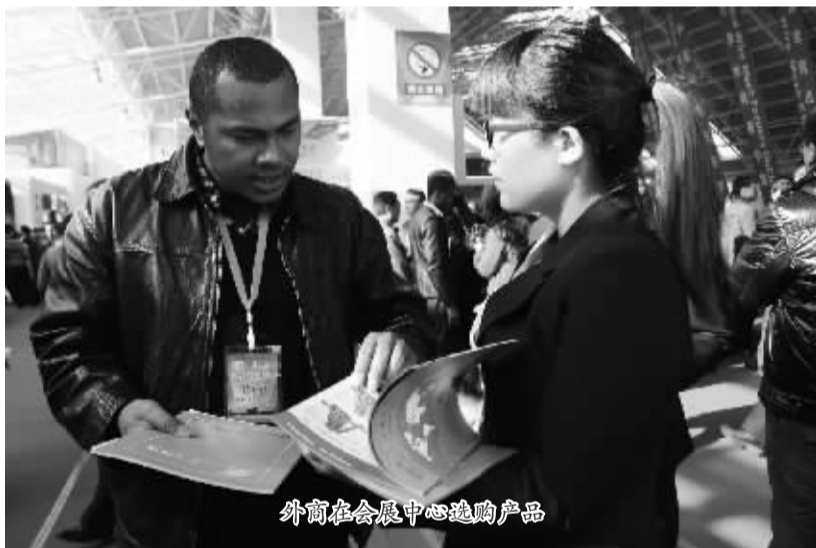
外商在会展中心选购产品

今年即将于10月22日至24日举办的第十三届中国·安平国际丝网博览会欧美采购商明显增多,预计到会外商可达600多人,将会让安平“丝网之都”的美誉名扬四海。