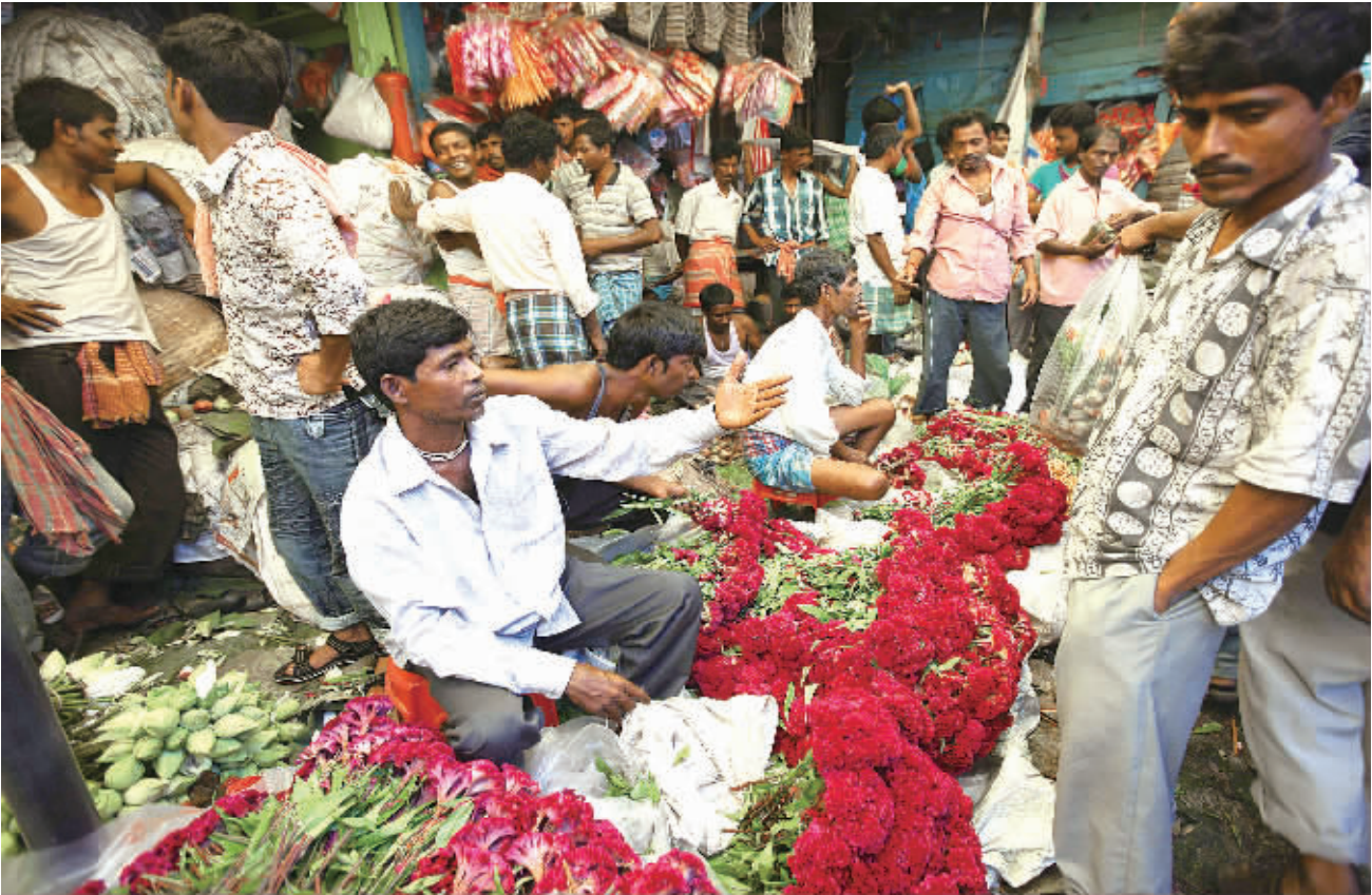
日前，小贩在印度加尔各答市的鲜花市场卖花。印度加尔各答市10日迎来一年中最重要的节日——杜尔加女神节，以庆祝土地的肥沃和丰收。许多市民来到市场购买鲜花，用于祭祀和装点家庭。

新加坡金钻珠宝商会会长何乃全在接受采访时说，随着经济全球化步伐的加快，珠宝行业内的竞争会越来越激烈。他希望通过经常举办这样的展览，把新加坡打造成东南亚地区的珠宝中心。