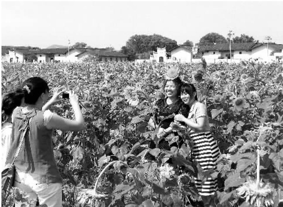
国庆期间,江西省瑞金市红井景区数百亩向日葵竞相开放,红色旧址、绿色田野和金色葵花交相辉映,构成一幅独具特色的田园风光画,吸引各地游客纷至沓来。

据介绍,乘坐动车时吸烟,不仅危害他人的身心健康,更有可能影响行车安全,影响整条线路的列车运行秩序,甚至危及列车和旅客生命财产安全。为了保障运行安全,动车组上安装了多个故障传感器和烟雾报警器,一旦有人吸烟,列车上的烟火报警系统就会报警,列车就会减速运行甚至停车。日前,国务院颁布《铁路安全管理条例》已明确规定:自2014年1月1日起,旅客在动车组列车上吸烟属于违法行为。