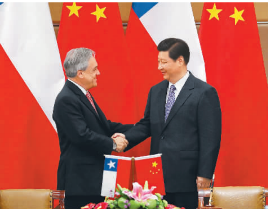
10月6日,国家主席习近平在印度尼西亚巴厘岛会见智利总统皮涅拉。

特色产品,支持有实力的中国企业赴智利投资兴业,希望智方提供支持和便利。三是发挥技术、资源、融资互补优势,积极开展矿业产业链合作,农、林、牧、渔业生产加工合作,新能源、生物技术、极地海洋等领域科技创新合作。四是鼓励人文交流,特别是两国青少年交往。五是在亚太经合组织内密切沟通和协调,携手维护亚太地区繁荣稳定。共同推动建立中拉合作论坛。中方赞赏智利等拉美国家发起成立拉美太平洋联盟,致力于推动贸易自由化,主张加强同亚太国家经贸联系,愿同联盟开展合作。