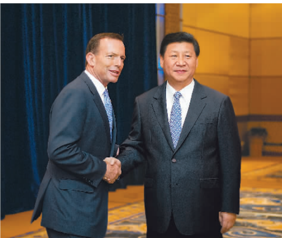
10月6日,国家主席习近平在印度尼西亚巴厘岛会见澳大利亚总理阿博特。

尊重彼此核心利益和重大关切,客观理性看待各自战略意图,在包容互鉴中实现共同进步,在深化合作中追求共赢。二是经贸纽带。双方要本着互利双赢、互谅互让精神,推动两国自由贸易协定谈判早日取得实质进展。继续拓展能源资源等传统领域合作,积极开辟基础设施建设、信息技术、节能环保等合作新领域。三是人文纽带。双方要扩大教育、文化、青年等领域交流,加深相互了解和友谊。四是安全纽带。双方要继续通过防务战略磋商、军舰互访等方式加强两军交流。