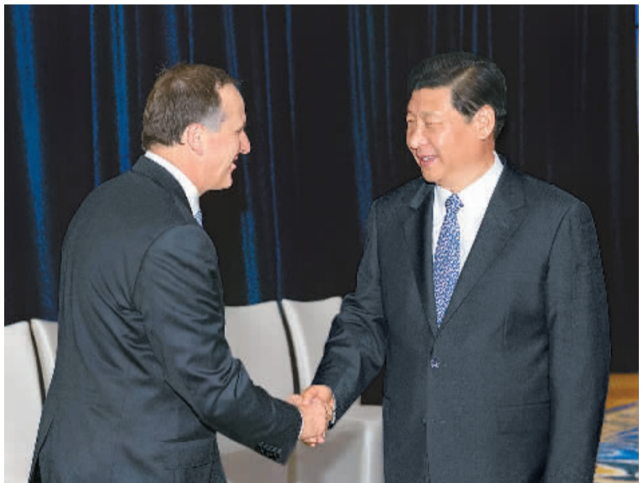
10月6日,国家主席习近平在印度尼西亚巴厘岛会见新西兰总理约翰·基。