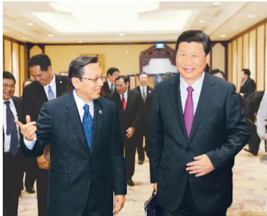
10月3日, 国家主席习近平在雅加达会见印度尼西亚副总统布迪奥诺。