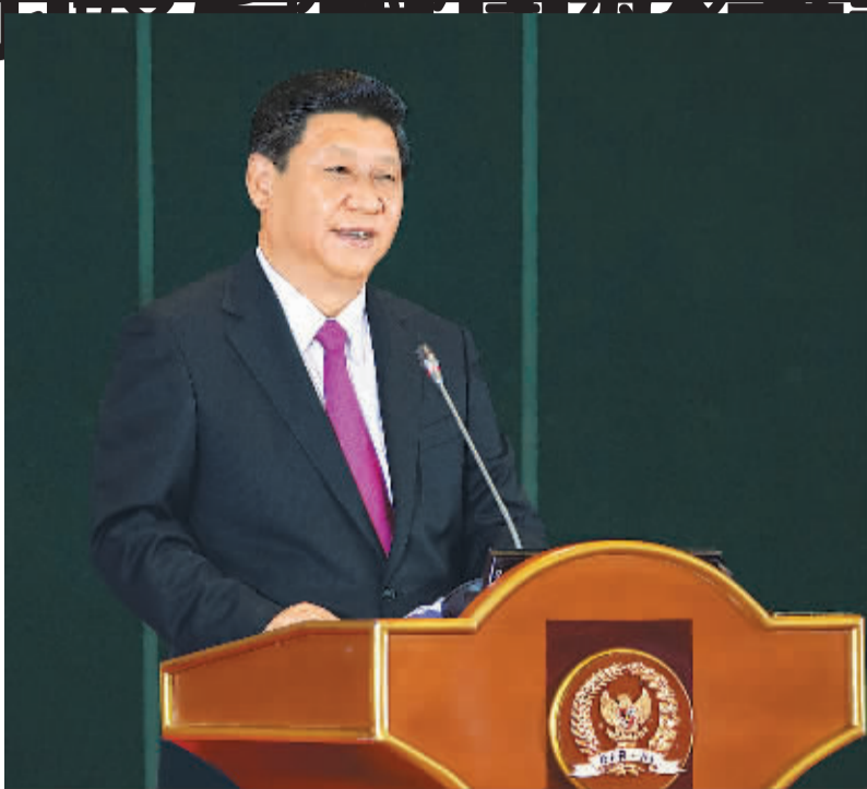
10月3日, 国家主席习近平在印度尼西亚国会发表题为《携手建设中国—东盟命运共同体》的重要演讲。

本报雅加达10月3日电 记者李国章 王涛报道: 国家主席习近平3日在印度尼西亚国会发表题为《携手建设中国—东盟命运共同体》的重要演讲, 全面阐述中国对印尼和东盟睦邻友好政策, 提出加强中印尼全面战略合作伙伴关系, 建设更为紧密的中国—东盟命运共同体, 实现共同发展、共同繁荣。