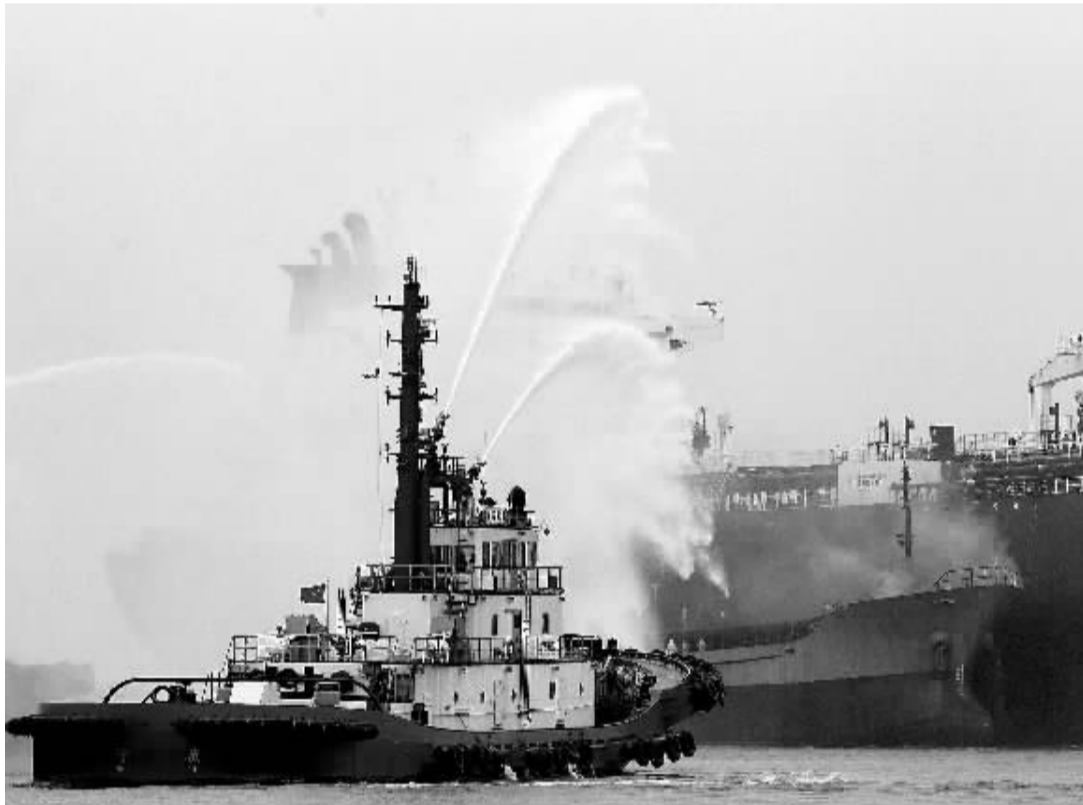
9月23日上午,2013海上重大溢油应急处置演习在广西举行。这是我国国家层面首次针对重大海上溢油进行的专项演练,也是国家重大海上溢油应急处置部际联席会议制度建立以来的第一次国家层面演练。

本报北京9月23日讯 记者郭存举报道:由中国传媒大学广告主研究所主办的2013—2014中国营销传播趋势论坛暨《广告主蓝皮书》发布会,今天在中国传媒大学举行。论坛上发布了《广告主蓝皮书——中国广告主营销传播趋势报告NO.7》,论坛主题为“融合·升级——缔造营销传播新生态”,论坛以独特视角剖析了中国广告行业的发展现状,并对广告产业在未来的发展趋势进行了充分探讨。