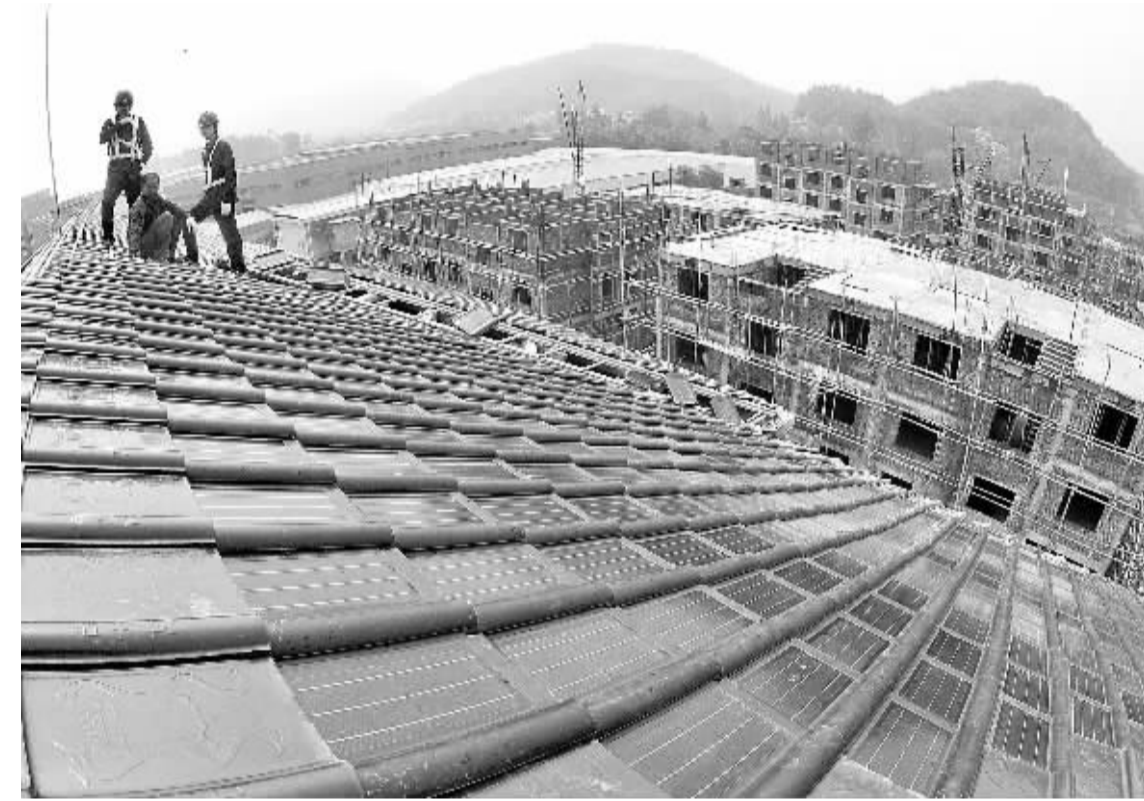
国家电网富阳市供电公司技术人员帮助农村居民安装光伏发电项目(9月13日摄)。

发言人透露,中国结算公司将在总部新建“统一账户平台”,在同一投资者名下各证券账户关联的基础上,为每名投资者配发“一码通证券账户”,实现证券账户开立业务的统一运营和投资者信息集中管理。