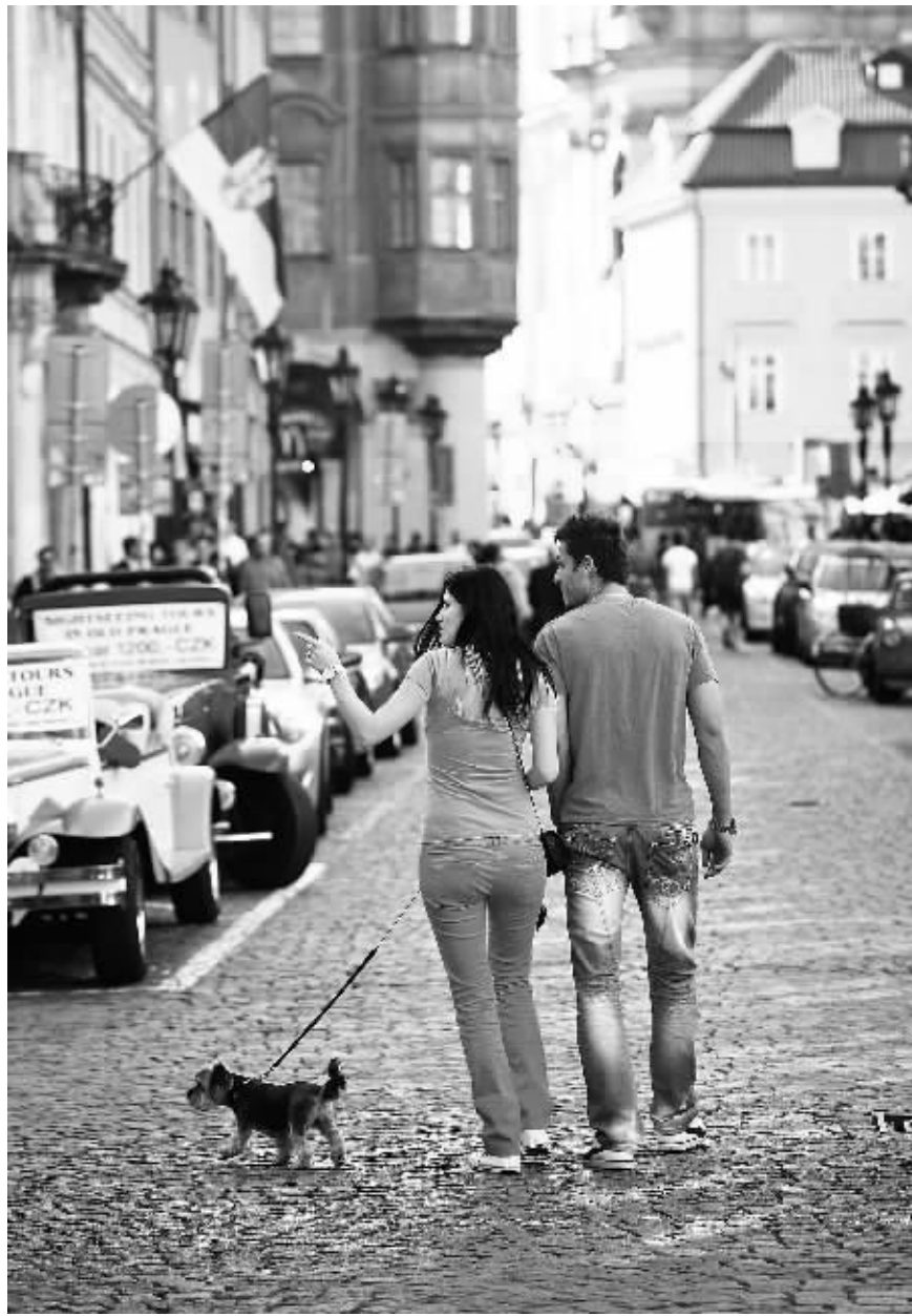
9月11日，一对情侣牵着狗，漫步于布拉格的老城区。捷克首都布拉格是一座拥有“千塔之城”、“金色城市”等美誉的历史名城。身在中，仿佛置身于童话世界，梦幻般的美景让无数旅行者对这座“欧洲最美城市”流连忘返。

长远来看，埃及政府则希望不断削减财政补贴，逐步退出能源补贴，从而减少国家的财政负担。埃及财政部长加拉尔表示，政府可能会在未来2至3年内消除能源的国内外差价，并针对重工业企业开始削减能源补贴，但考虑其对国民生活的影响，在能源补贴取消的过程中，普通消费者将会是最后进行改革的人群。