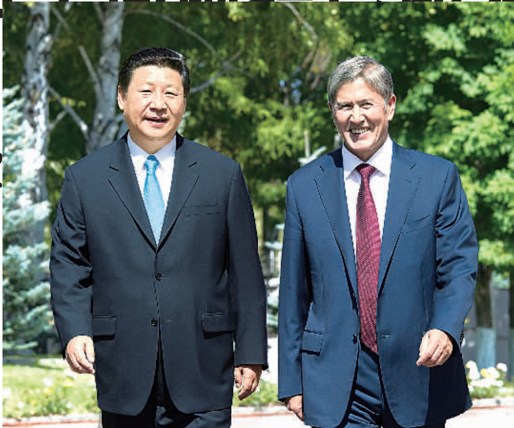
9月11日, 国家主席习近平在比什凯克同吉尔吉斯斯坦总统阿坦巴耶夫举行会谈。