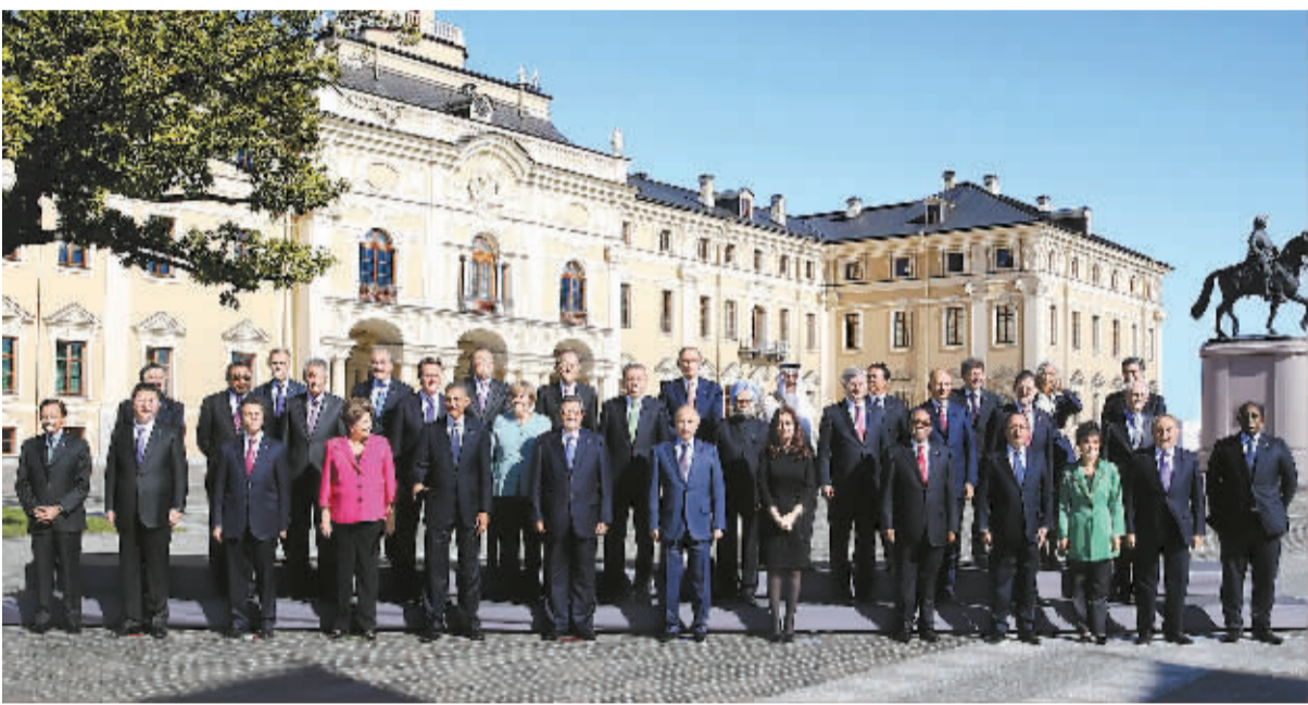
9月6日,国家主席习近平在圣彼得堡出席二十国集团领导人第八次峰会。这是与会各国领导人及有关国际组织负责人集体合影。

本报圣彼得堡9月6日电 记者廖伟径报道:二十国集团领导人第八次峰会6日在俄罗斯圣彼得堡继续举行,国家主席习近平出席,就贸易等议题发表讲话。