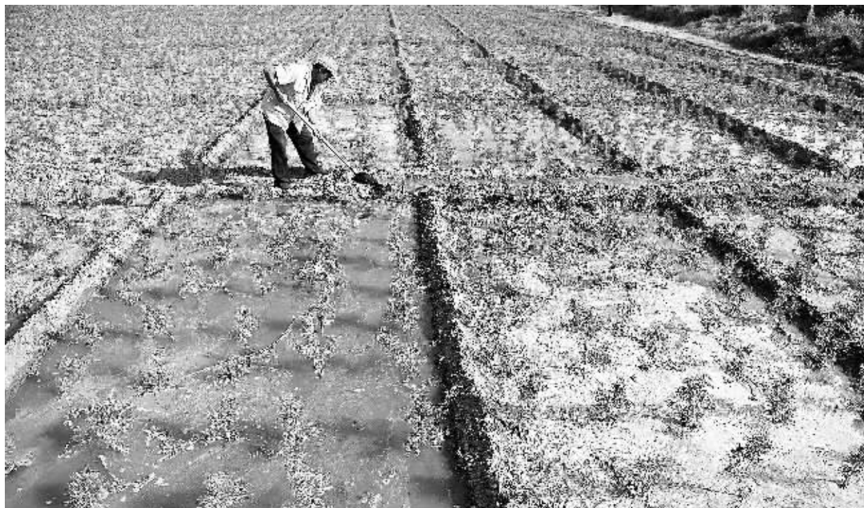
在山西省右玉县右卫镇高墙框村，一位村民在苗圃内为樟子松幼苗做田间护理(8月26日摄)。

右玉县位于晋西北边陲，属“三北”地区长城沿线潜在沙漠化区域，新中国成立前，全县森林覆盖率不到0.3%。60多年来，右玉县干部群众坚持不懈植树造林、改善生态，目前右玉县拥有林木面积150多万亩，森林覆盖率增长到53%，“不毛之地”变成了“塞上绿洲”。小小苗木，不仅绿了右玉的一方山水，也成了当地农民的“绿色聚宝盆”。