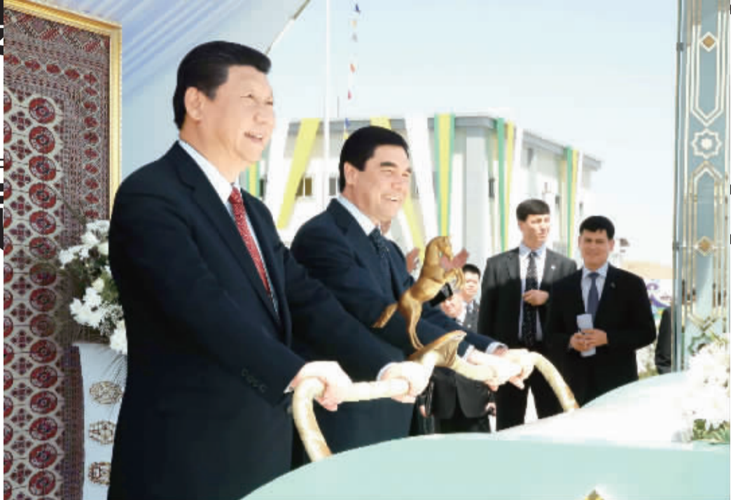
9月4日,国家主席习近平同土库曼斯坦总统别尔德穆哈梅多夫共同出席中国石油天然气集团公司承建的土库曼斯坦“复兴”气田一期工程竣工投产仪式。这是习近平同别尔德穆哈梅多夫出席“复兴”气田第二、第三天然气处理厂投产仪式。