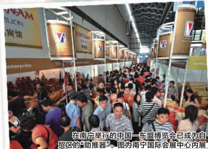
在南宁举行的中国—东盟博览会已成为自贸区的“助推器”。图为南宁国际会展中心内展馆一角

手段,重点推进中国—东盟物流基地等物流园区和商贸中心的规划和建设,推进保税物流中心(二期和三期)、华润万象城、大商汇、海吉星农产品国际物流中心、中国—东盟商品交易中心等一批重大商贸物流项目建设。南宁市服务广西、面向中国、辐射东盟的市场体系正在形成。 此外,南宁市优化首府金融发展环境,大力实施“引入金入邕”战略,华夏、民生、兴业、招商、中信、浦发等国内股份制银行,南洋、星展和汇丰等外资银行均到南宁落户,东盟国家、中国香港、内地的金融机构纷纷到南宁设立分支机构或办事处。2010年6月,南宁成为国家第二批跨境贸易人民币结算试点城市,区域性金融中心功能不断增强。 十年里,这座城市的经济实力显著增强。2012年,南宁市全地区生产总值达到2503.55亿元,同比增长12.3%,总量是2003年(521.78亿元)的4.8倍。全市经济总量居全区14市首位,全国5个自治区首府城市首位。三次产业比例由2003年的19.11:29.20:51.69调整到2012年的12.95:38.30:48.75,第一产业的比重逐年下降,第二产业的比重逐年提升,经济结构进一步优化。2012年,全市财政收入422亿元,总量是2003年的6.9倍。2012年全市社会消费品零售总额达到1255.59亿元,总量是2003年的4.35倍。2012年全社会固定资产投资额达2585.18亿元,总量是2003年的13.6倍。 从边陲之城向中国—东盟合作前沿城市的大跨越,成为南宁这座城市10年来一条完美的轨迹。