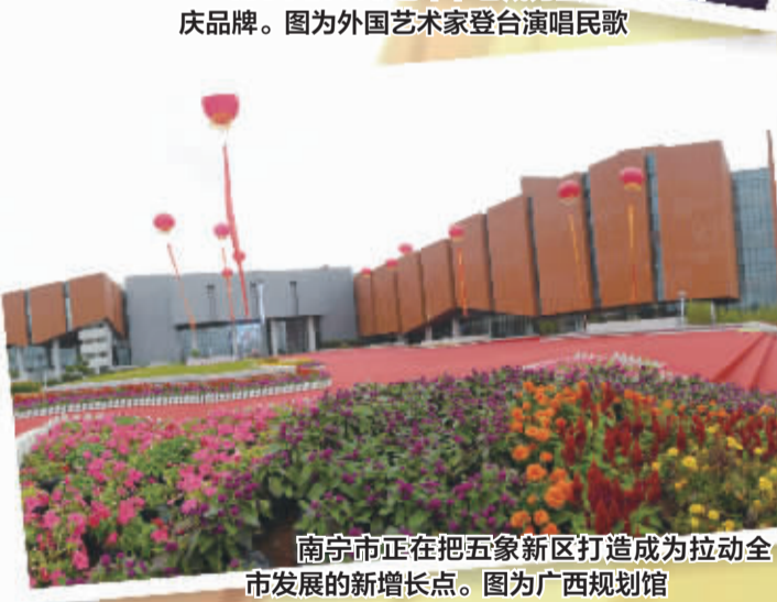
南宁市正在把五象新区打造成为拉动全市发展的新增长点。图为广西规划馆

在中国—东盟博览会举办十周年、中国—东盟建立战略伙伴关系十周年之际,中国—东盟博览会的永久举办地南宁市将作为魅力之城绽放新形象。 中国—东盟博览会的举办,使南宁的区位优势转化成开放优势,从南国边陲转变成成为促进中国—东盟合作的“南宁渠道”,区域地位与影响力与日俱增。这座魅力无限的城市,在开放中融合,在融合中升华,在这一过程中她的魅力不断释放、增强,成为国内国际区域经济合作大舞台上一颗光彩夺目的新星。 2004年金秋时节,首届中国—东盟博览会在广西南宁举行,该博览会由此成为中国和东盟之间开展全方位合作的新模式,成为中国与东盟沟通的“南宁渠道”。通过这一渠道,中国与东盟各国之间形成了多个合作机制,促进经贸合作和交流沟通。 通过这一兼具政治、外交、经济意义的渠道,中国与东盟国家领导人之间、部长之间和地方领导人之间经常进行交流,促进了中国与东盟战略合作关系的进一步发展。每年一届的中国—东盟博览会暨商务与投资峰会受到与会各国政府的高度重视,各国领导人高规格出席已日益形成机制化,加之政商各界精英云集,推动跨区域合作效果