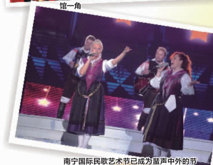
南宁国际民歌艺术节已成为蜚声中外的节庆品牌。图为外国艺术家登台演唱民歌