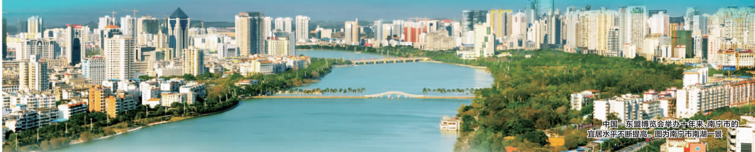
中国—东盟博览会举办十年来,南宁市的宜居水平不断提高。图为南宁市南湖一景

“相聚到永久,风雨并肩走,看东方我们同声唱,我们永远是朋友。”随着中国—东盟博览会会歌《相聚到永久》的旋律一次次地在南宁国际会展中心响起,中国—东盟博览会在南宁已走过十年岁月。