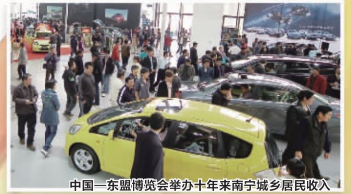
中国—东盟博览会举办十年来南宁城乡居民收入大幅增长,消费热情高涨,市民生活水平显著提高

务;三是积极推进五象新区、工业园区和南宁保税物流中心建设,打造对外开放合作的平台与载体;四是深化以东盟为重点的对外开放,支持更多的中国—东盟合作机构落户南宁,支持完善中国—东盟合作机制。同时加快发展面向东盟的进出口贸易,积极举办东盟主题文化交流活动,推进南宁与东盟各国无障碍旅游圈建设等,力促企业与东盟实现对接;五是按照建设区域性国际城市的要求推进城市建设,增加东盟元素,提升人居环境。 目前,柬埔寨、越南、泰国、老挝、缅甸等东盟国家已在南宁设立总领事馆,东盟十国、日本、韩国商务联络部建成使用,南宁建设中国—东盟“三基地三中心”的进程正加快推进。 截至目前,南宁市已有80家外经企业“走出去”赴境外投资开办企业,投资总额12.30亿美元,投资足迹遍布21个国家和地区,全市先后派出工程劳务人员3000人次,累计完成境外承包工程合同额逾3亿美元。2012年,南宁对外贸易延续了2004年以来的增长态势,全年进出口贸易总额达41.47亿美元,比2004年增长551.02%。 十年来,南宁城市知名度不断提高,区域性国际化城市功能快速提升。开放成就了南宁,开放的南宁魅力更加迷人!