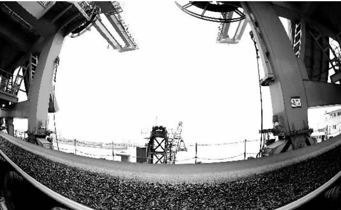
湖北兴发集团宜都生态工业园港口码头正在进行矿石、产品装运作业。该码头是当地借助长江黄金水道兴建的原材料及产品运输为一体的物流运输枢纽，年吞吐量200万吨，今年以来已完成货物装卸量150万吨。

锦屏一级水电站是国家开发投资公司和四川省投资集团公司在雅砻江投资兴建的大型水电站。锦屏一级水电站装机60万千瓦机组6台，总装机容量360万千瓦，多年平均年发电量166.2亿千瓦时。锦屏一级水电站正常发电后，每年可节约原煤768.2万吨，减少排放二氧化硫10.5万吨。