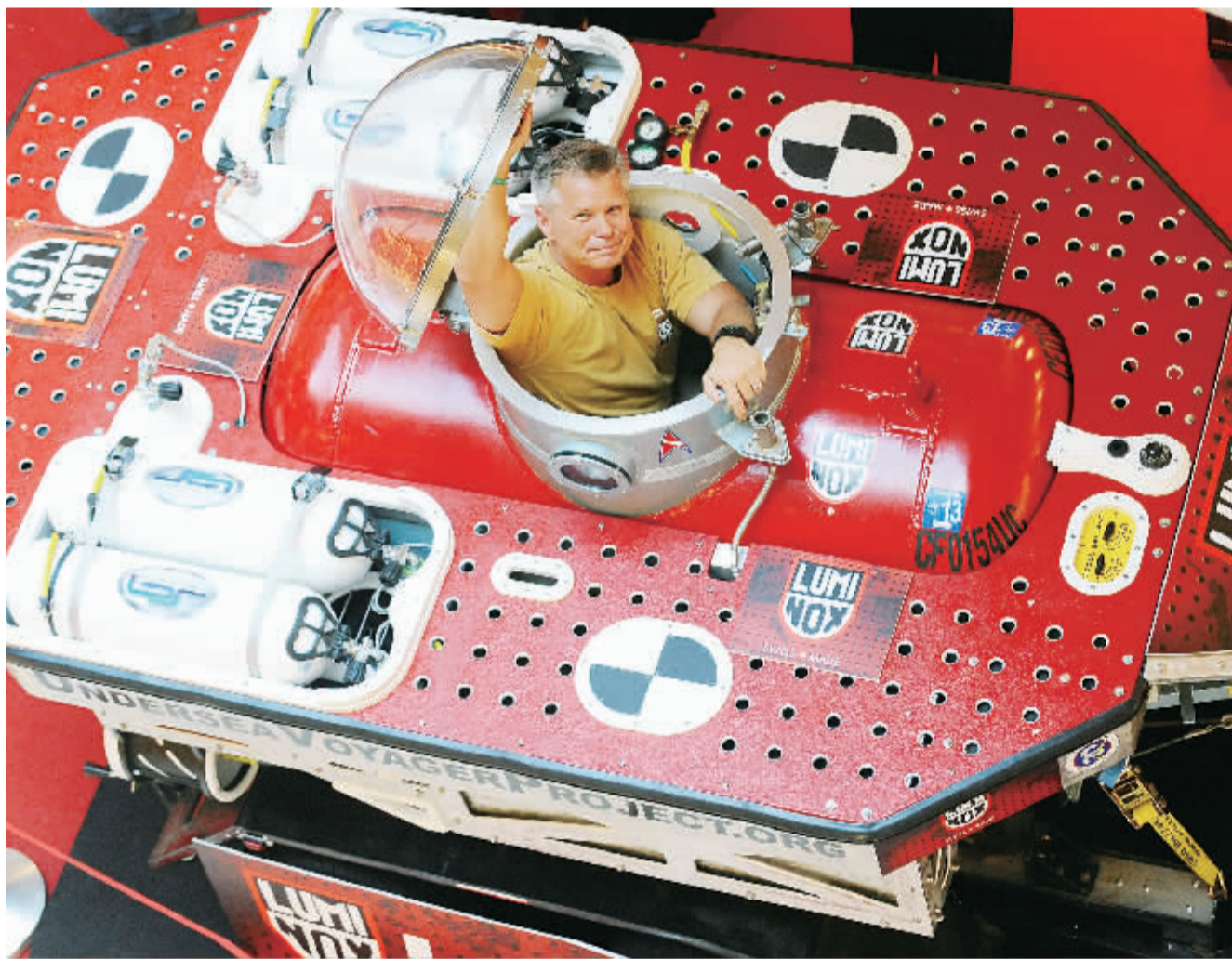
8月29日，美国海洋环保主义者斯科特·卡斯尔在新加坡与其自制的潜水艇合影。

华为以客户为导向的发展战略是其最大优势之一。华为将客户的需求作为研发创新的出发点，使得其产品和服务很快就得到了欧洲客户的高度认可。