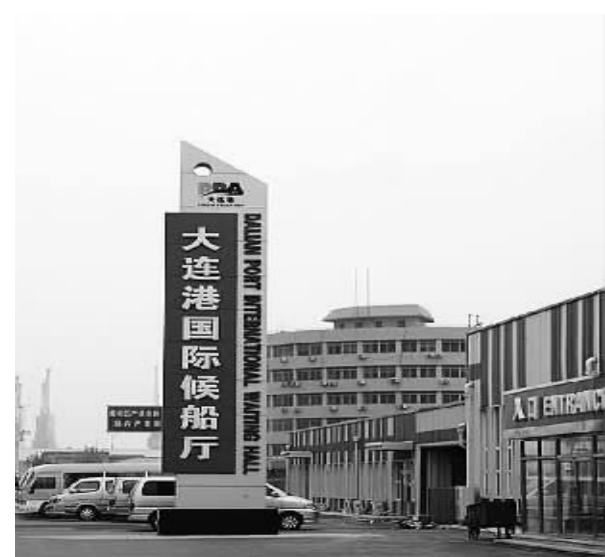
今年5月底新启用的大连港国际候船厅外景。