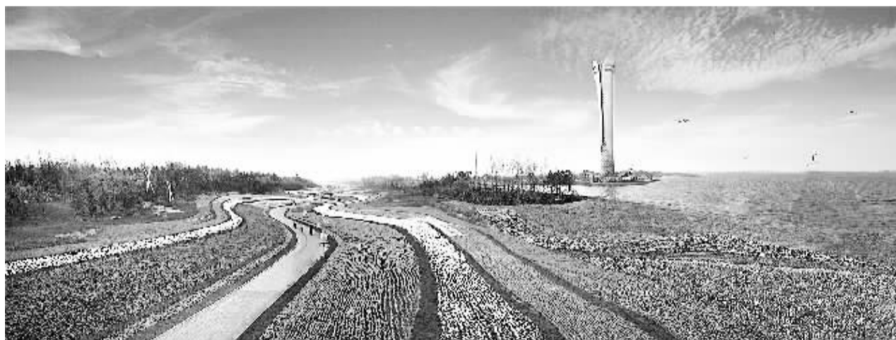
世界园林博览会园区蝶恋花谷。

今夏的辽宁海滨格外热闹，不仅国内避暑的旅客纷至沓来，就连我国近邻日本、韩国、俄罗斯等国家和地区的游客也把辽宁的海岸线作为今夏旅游目的地。海岸线上，讲着各国语言和操着国内各地方言的游客，让辽宁沿海地带变成了国际旅