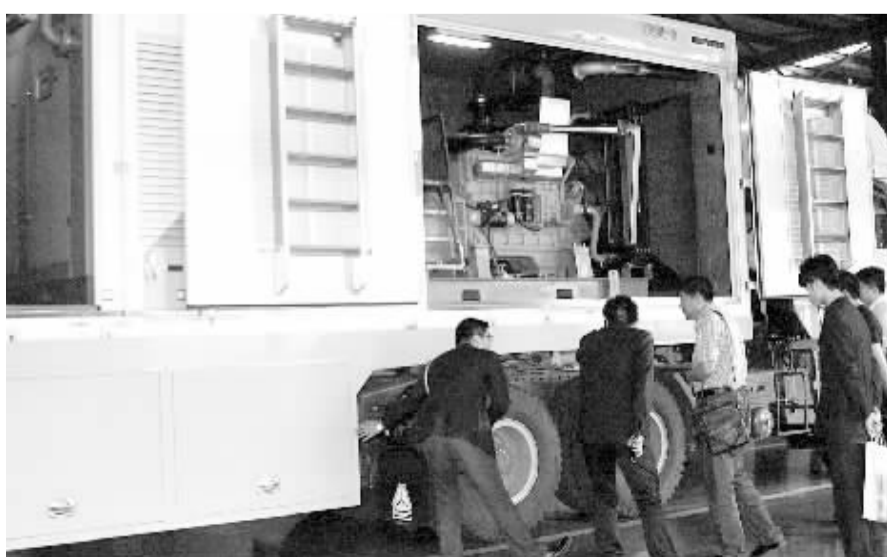
辽宁卓异装备制造有限公司生产的矿用应急救援车、防爆指挥车等9大新品领先国内同行。图为多功能矿用应急救援车下线。