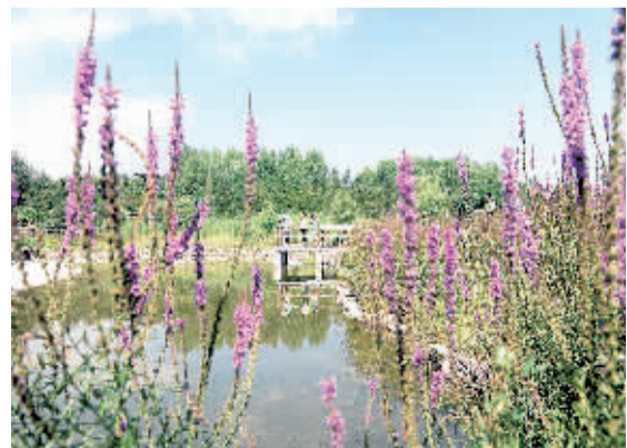
8月26日,游客在山西大同智家堡森林公园游玩。该公园占地面积30万平方米,曾经是大量生活垃圾的倾倒地,经过规划建设,已成为让人流连忘返的生态园。