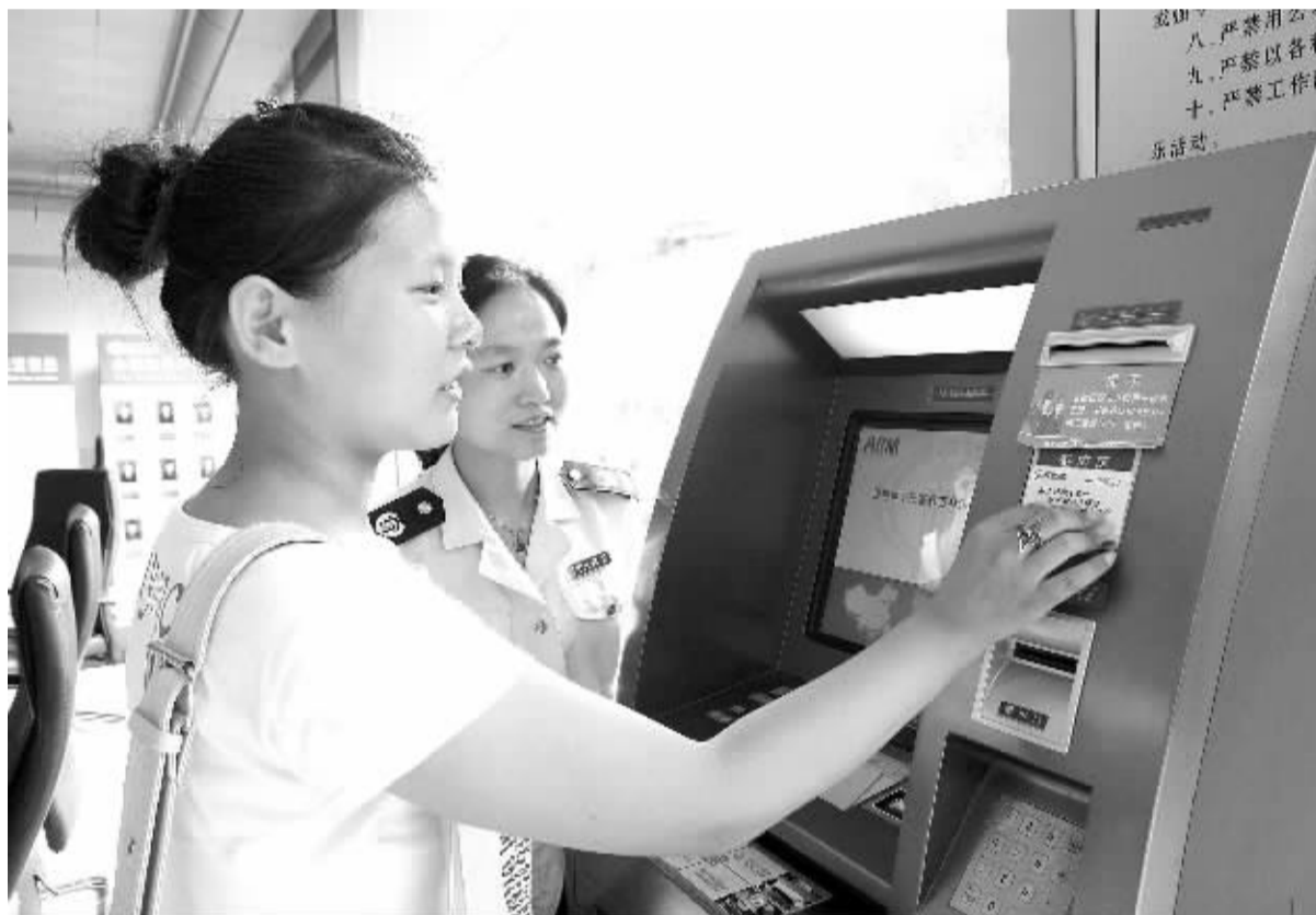
为方便小微企业纳税,河北邢台市推出24小时自动报税系统。近年来,该市积极采取多项措施助推小微企业发展,在全国率先推行政府服务“零收费”和行政处罚款减半,减轻了小微企业负担。