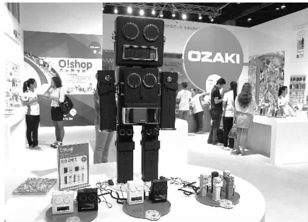
8月22日,观众在2013数字世界亚洲博览会上参观移动充电器。

本报青岛8月22日电 记者顾阳报道:中日韩自贸区建设青岛论坛今天在山东青岛举行,来自商务部、中日韩3国合作秘书处、中国国际贸易学会、三星经济研究所等国内外多家机构的百余位代表,就中日韩自贸区建设以及加强地方城市合作进行了探讨。据悉,中日韩三国的经济总量占到亚洲的70%和东亚地区的90%,中日韩自贸区建设对于改善各自经济发展环境、推动经济发展都将起到积极作用。