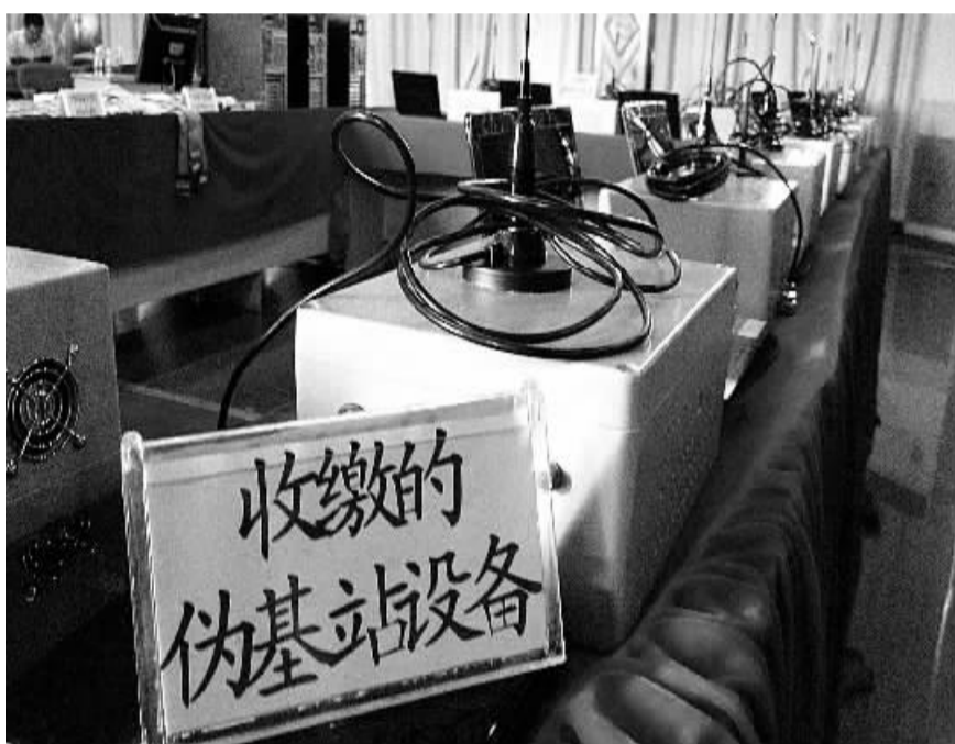
上图 专案组赴深圳进行收网行动时,收缴的“伪基站”设备6套、半成品2套、定位设备1套,生产“伪基站”设备的零部件一批。

去年10月的一天,苏先生按约定来到深圳市宝安机场接一客户。下午3时,苏先生刚进入机场,手机就失去了信号。眼看客户的飞机就要落地,苏先生只好又开车驶出机场寻找信号,终于在近两公里外的国道上与客户取得了联系,并拨通了10086进行投诉。