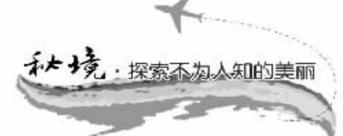
秋境·探索不为人知的美丽