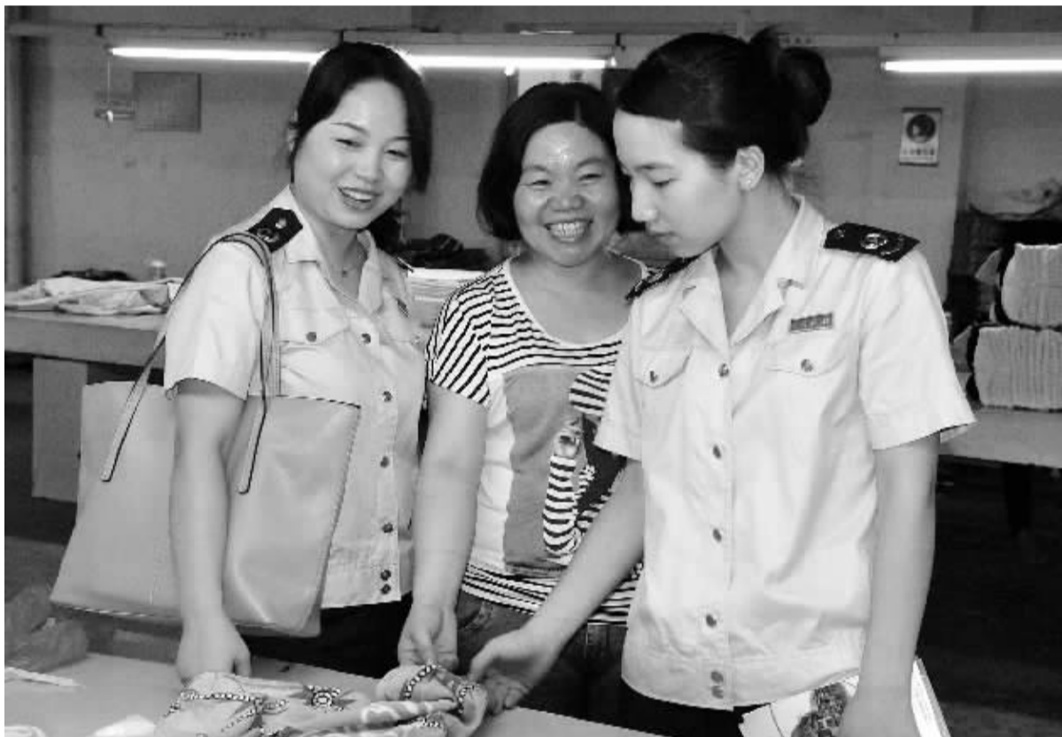
湖南华容县积极鼓励企业创业吸纳下岗失业人员再就业,上半年新增创业项目14个,带动就业近万人,其中850名下岗人员实现再就业。图为华容县国税服务小分队“点对点”了解企业生产销售情况,帮助落实安置下岗失业人员税收优惠政策。