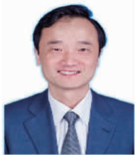
国家统计局中国经济景气监测中心副主任 潘建成