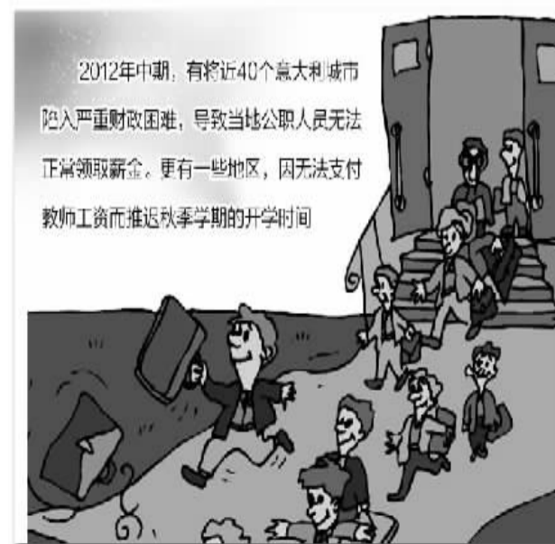
2012年中期,有将近40个意大利城市陷入严重财政困难,导致当地公职人员无法正常领取薪金,更有一些地区,因无法支付教师工资而推迟秋季学期的开学时间

五是中央政府应深入了解地方政府的财政状况和财政风险,及时有效整治地方财政风险。美国的地方政府财政风险并非个例,此前华盛顿特区、加利福尼亚州、佛罗里达州等重要州都出现不同程度的地方债务风险。2003财年至2010财年,美国州政府已将每年的支出预算从1.5万亿美元提高至近2.2万亿美元,但税收收入增加不到4000亿美元,仅达到1.4万亿美元,地方政府的财政缺口日益扩大。对于中国,地方债务规模测算口径差异较大,2010年地方债务规模存在7万亿元人民币至12万亿元人民币的不同测算结果,还不包括隐性负债。最近几年来,社会融资规模的快速膨胀,地方政府的债务规模应该是水涨船高。因此,应该定期进行“压力测试”,保障整个财政体系的可持续发展,以服务于宏观经济平稳发展和结构转型大局。