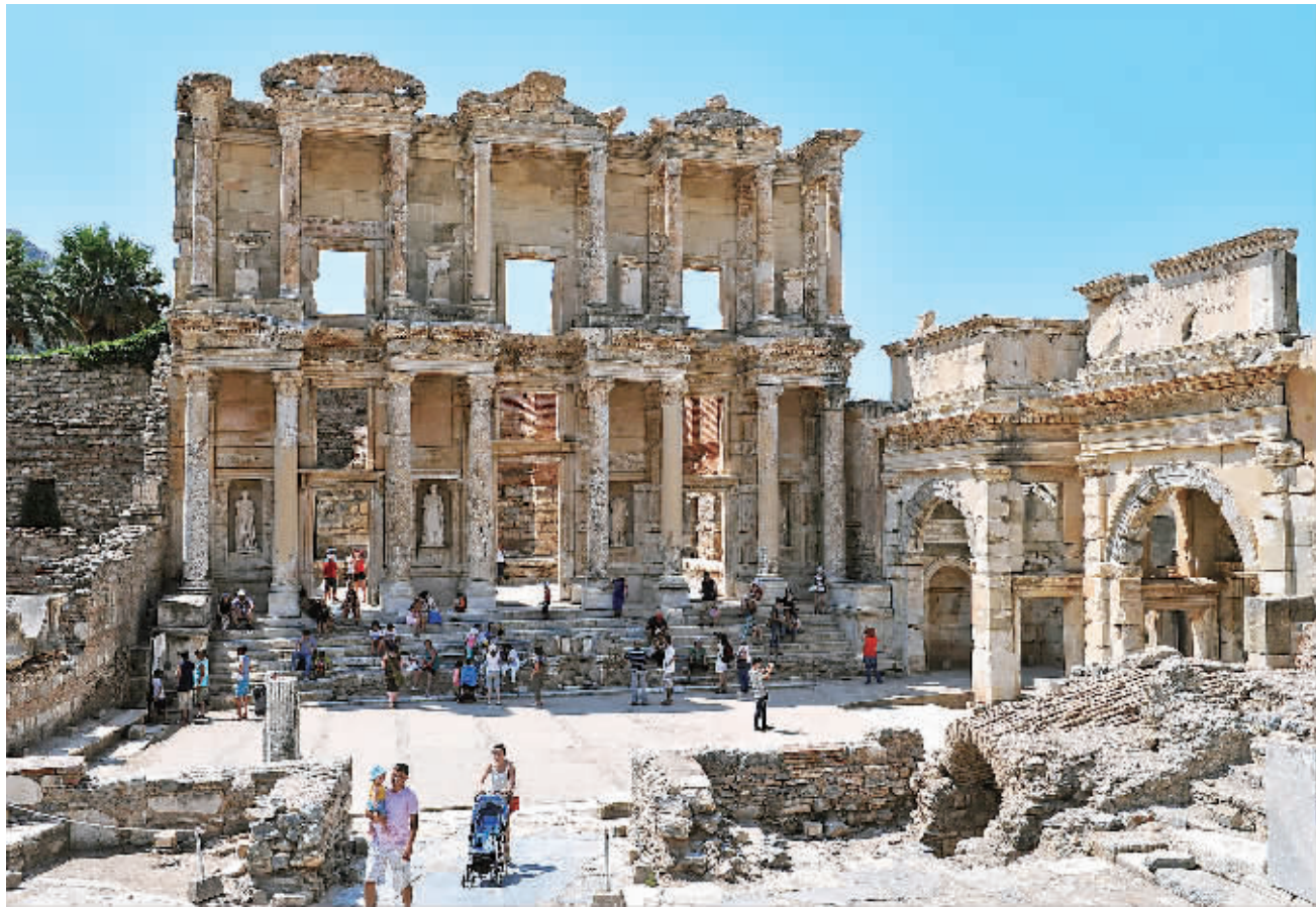
7月28日,在土耳其伊兹密尔,游客们在以弗所古城中的塞尔萨斯图书馆遗址前游览。以弗所城在公元前10世纪建立,曾是东地中海地区最重要的城市之一,被誉为文化和宗教的中心。

新加坡金融管理局预测,新加坡经济在今年下半年的表现有望超越上半年,增长率约为2%,其中金融服务业全年的增长预计将超越去年。与此同时,新加坡也在人民币进一步国际化的过程中扮演了非常重要的角色。不久前,新加坡被中国宣布为人民币合格境外机构投资者试点计划的新增地点。这意味着在新加坡运营的金融机构可以扩大人民币投资产品,以满足客户需求。