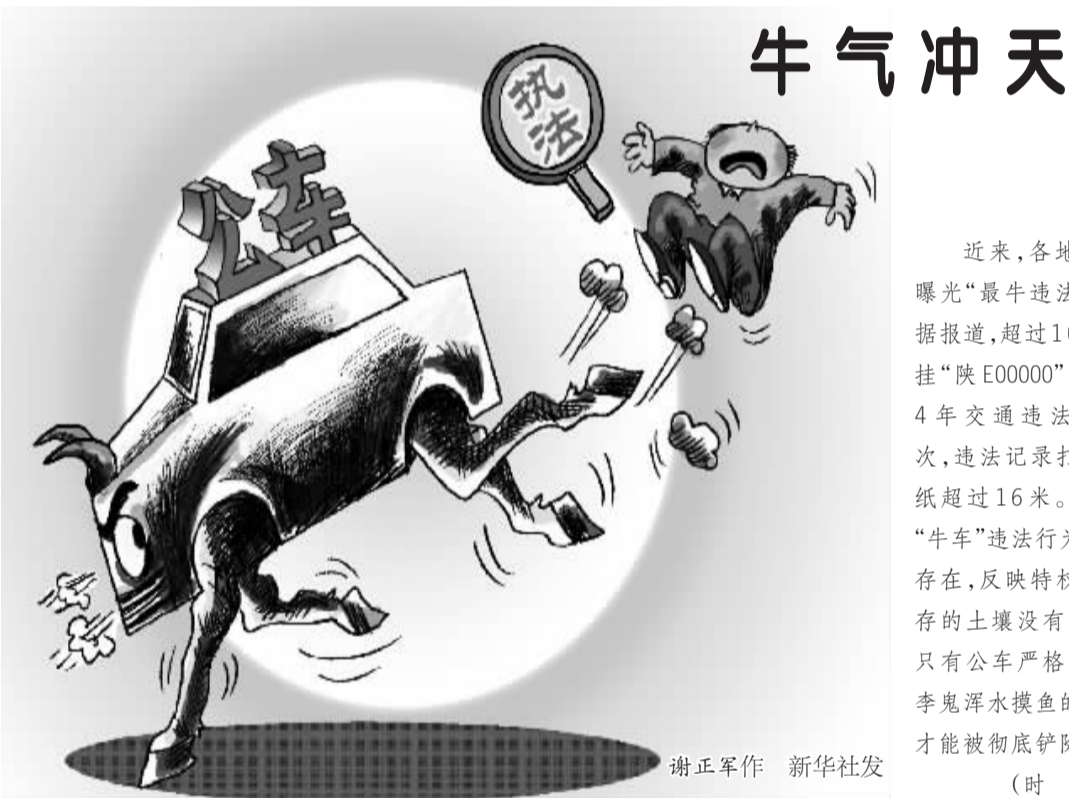
谢正军作 新华社发

其实，这才是农民工们的真正心声，即便是“冷对”落户政策的优秀农民工们，也并非不想要城镇户籍，而是不知道这个户籍对他们有何损益。在更多的农民工看来，或许只有在城镇户籍不再仅仅是一种优待而是一种普惠时，他们的城市梦才能真正实现。(原载于7月25日《工人日报》，文章有删改)