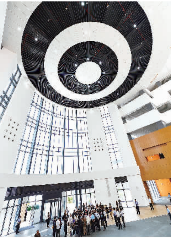
图为7月20日拍摄的澳门大学横琴新校区图书馆。当日,位于广东珠海的澳门大学横琴新校区开始由澳门特区政府接管,校区内实施澳门特别行政区的法律。

台旅会会长董事赖瑟珍在接受媒体采访时表示,5年来,大陆居民来台旅游,加上探亲、商务等交流活动,估计带给台湾约4800亿元新台币。回顾两岸旅游交往对台湾的影响,她最大的感触就是“一业兴,百业旺”。