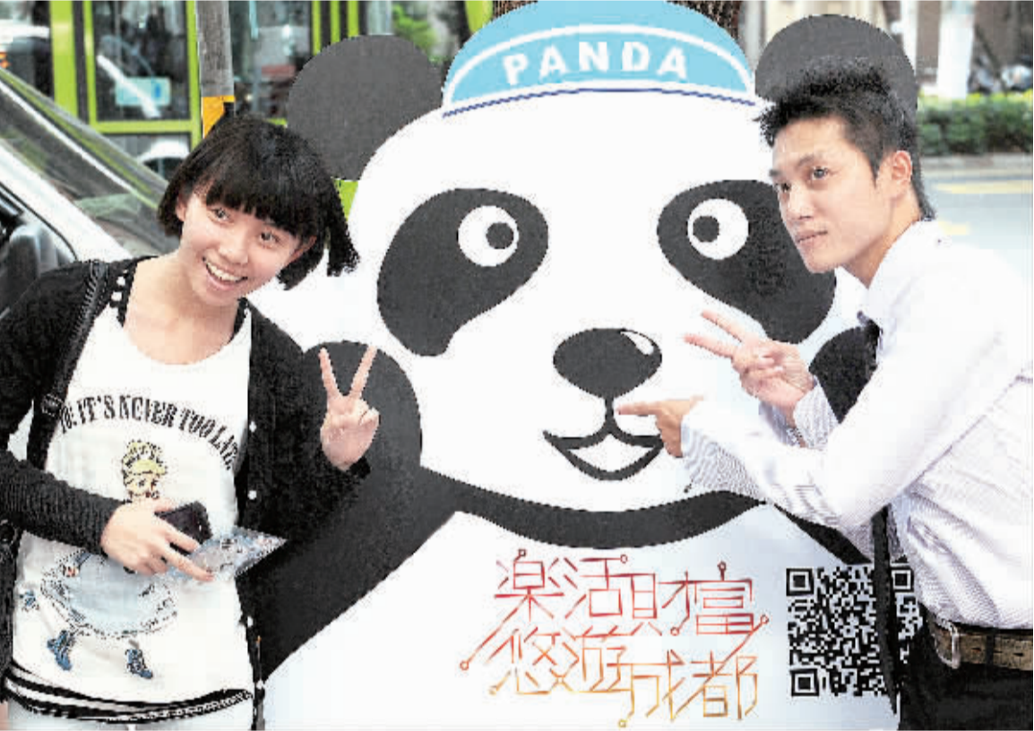
7月23日,台北市民在活动现场与大熊猫形象的宣传招牌合影。当日,成都旅游局在台北市举办“乐活财富 悠游成都”推介活动,向台湾民众介绍成都的旅游景点和民俗民情。

本报讯 记者周剑、实习生刘美龄报道:香港特区政府日前向立法会提交改革方案,拟成立负责规管香港旅游业的“旅游业监管局”,并大幅提高开办接待内地团旅行社的成本。新法例草案将于明年提交立法会,旅监局最快有望2015年开始运作。据悉,自2010年以来,香港接连发生强迫内地游客购物及内地旅行团接待安排欠妥等事件,其中还涉及导游行为不当和“零负团费”等不良营商手法,令香港旅游业备受困扰。为此,香港特区政府于2010年10月公布改革旅游业现行规管架构的意向,并向公众咨询意见。香港立法会的最新公告显示,拟成立的旅监局将由政府委任的业界和非业界22名成员组成。香港特区政府还计划提高开设旅行社的门槛,将要求接待内地旅行团的旅行社缴纳80万港元的保证金。目前,香港约有350家接待内地旅行团的旅行社。香港特区政府将会向旅监局提供拨款,以支付成立费用和运作初期的部分营运开支。此外,香港特区政府建议,将目前香港旅游业议会向每个内地团收取的20港元登记费调高至200港元。