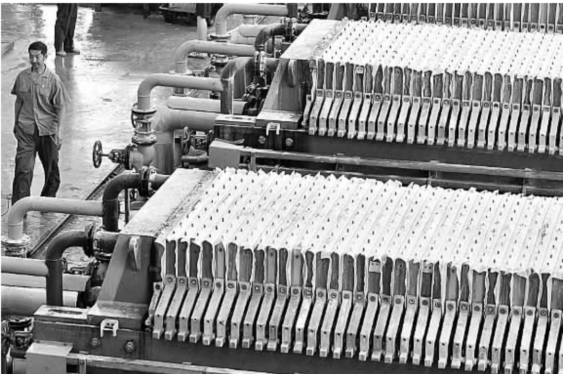
山东日照凌云海糖业集团工人在糖浆板框过滤车间巡视。今年以来,山东日照经济技术开发区将“大项目、大产业、大企业、大集团”四大战略作为拉动区域经济迅速崛起的引擎,有力促进了项目落地、行业聚集和产业发展。

训等基础性准备工作正按部就班、有条不紊地顺利推进。 这位负责人表示,要再次梳理各项准备工作,特别注意查遗补漏,进一步夯实征管准备,实现政策制度、技术保障、业务力量、应急预案全面到位。8月1日以后,要确保纳税人正常开票、顺利申报,税务部门平稳、正常征管。同时,要严密防控虚开发票等偷骗税风险。