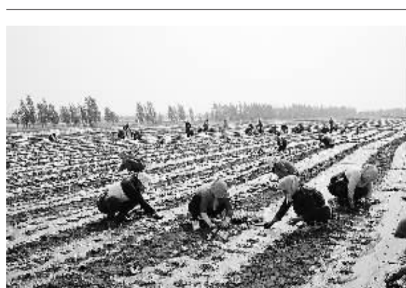
7月21日,河北尚义县七甲乡甲天农业合作社农民正在进行蔬菜膜下滴灌大田移植。近年来,河北尚义县大力发展现代化生态农业,仅蔬菜种植一项每年可使农民人均收入达3900元。

通知要求,地方各级卫生计生行政部门要将食品污染物和有害因素监测与食源性疾病预防结合起来,加强食源性疾病预防因素的溯源分析工作,及时发现食品安全隐患进行监测检验。