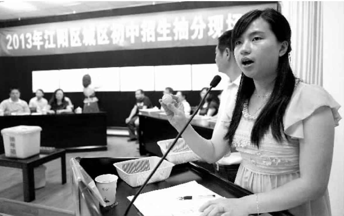
7月5日,四川省泸州市江阳区“小升初”抽分现场,工作人员展示抽分结果。为了体现公平、公正原则,在纪检监察部门、媒体代表、学生家长的见证下,江阳区对今年参加编组的1759名城区小学毕业生进行现场抽分。