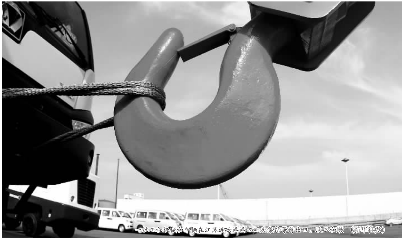
一批工程机械和车辆在江苏连云港港口码头集结等待出口。

数据显示,上半年我国粗钢增长7.4%,钢材增长10.2%,水泥增长9.7%,平板玻璃增长10.8%,十种有色金属增长10.0%,焦炭增长7.4%。因为市场需求增长相对有限,供求失衡的部分产品利润大幅下降,甚至出现越生产越亏损的局面。据统计,前5个月,国内86家中大型钢铁企业中有37家出现亏