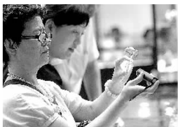
在北京农展馆,市民在北京国际珠宝展上挑选一款东海水晶。随着近期金价持续波动,珠宝玉器市场受关注度不断提高。