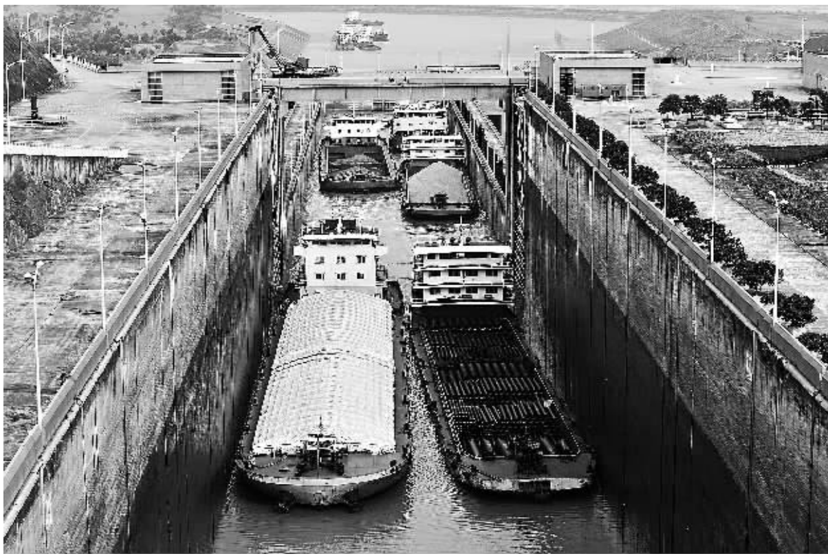
7月18日,船舶有序通过三峡五级船闸上行。

毛雷尔积极评价李克强不久前访问瑞士取得的成果,表示中国的发展给瑞士带来机遇,瑞方愿成为中国在欧洲的可靠合作伙伴,期待全面加强双边关系,造福两国人民。