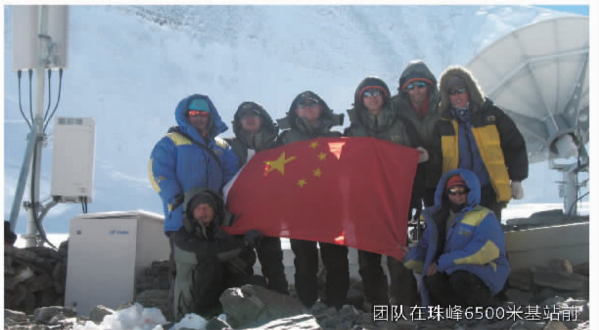
团队在珠峰6500米基站前