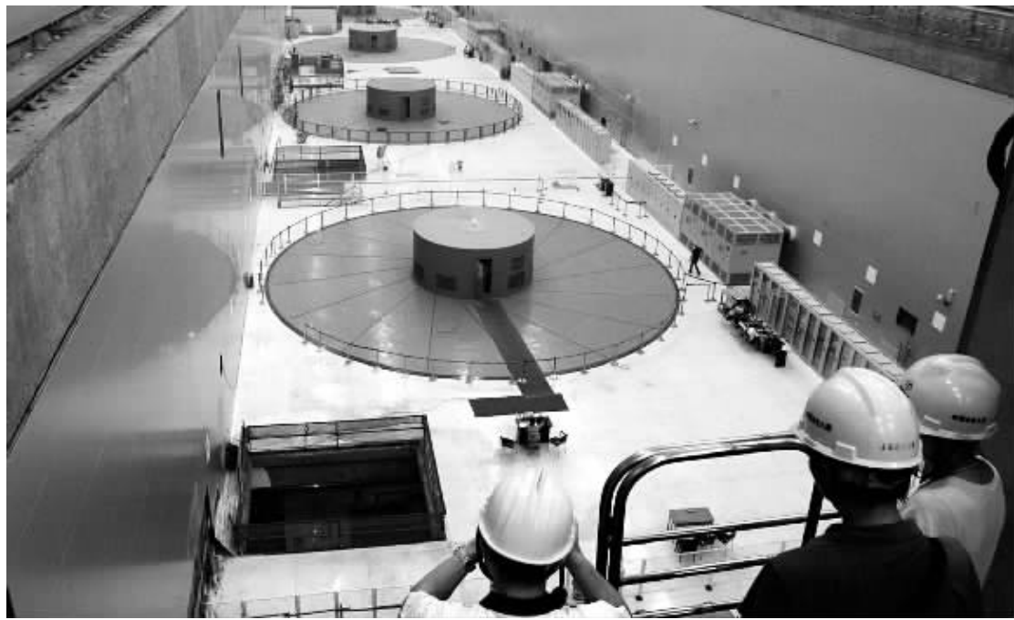
这是7月14日拍摄的溪洛渡水电站首台正式投产并网发电机组(13F)。

洪和改善下游航运等综合效益的大型水电站。溪洛渡水电站工程于2003年底开始筹建，2005年底开工，2007年实现截流，电站在左、右两岸各布置一座地下厂房，各安装9台单机容量77万千瓦的巨型水轮发电机组，电站总装机1386万千瓦，仅次于三峡电站和伊泰普电站。根据工程计划安排，溪洛渡电站工程在2013年实现首批机组发电，2015年工程完工。