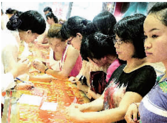
7月7日,市民在江苏省苏州市一家金店内挑选黄金饰品。近日,受纽约期货金价大跌影响,江苏苏州各大金店黄金饰品价格从6月下旬的348元/克下调至328元/克,吸引不少市民前来选购。