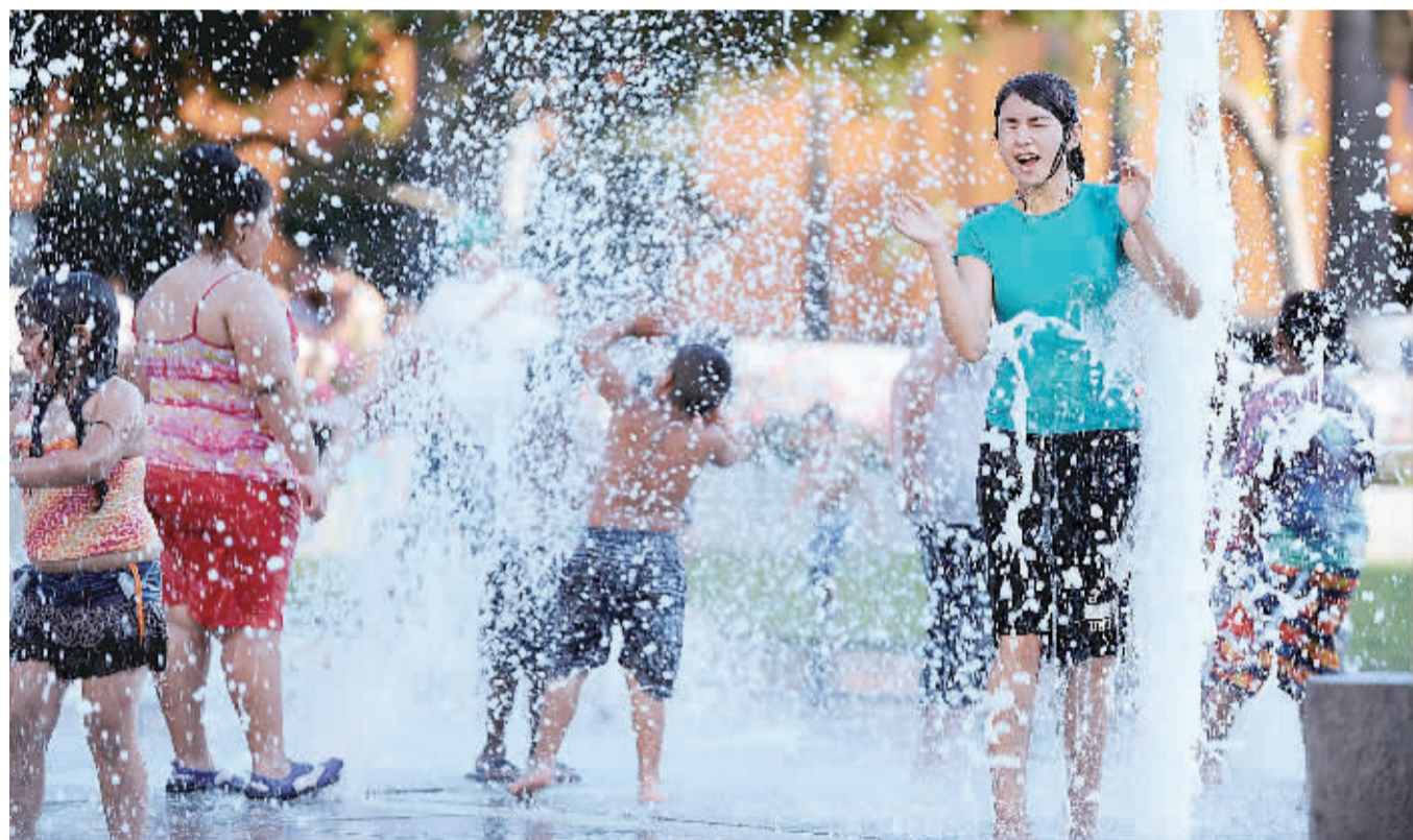
孩子们在美国加州北部圣何塞市中心一处喷水池戏水。圣何塞市近日最高温度一度达38.9摄氏度,市政府启用10个“降温中心”供民众使用。6月30日以来,加州北部城市旧金山及其周边地区持续高温,促使地方政府免费开放公共设施,帮助民众避暑。

为使民众了解肥胖的危险,养成良好的卫生习惯并提高国民健康水准,泰国卫生部针对儿童健康提出了10项措施:保持身体和常用物品干净;每天使用正确的方式刷牙;饭前便后洗手;吃煮熟的食物,避免吃不卫生、刺激性大的食物;不暴饮暴食;建立温馨家庭;预防事故;持续做运动,每年一次体检;保持性格开朗;培养社会责任感和良好的卫生道德,如把垃圾丢进垃圾桶等。