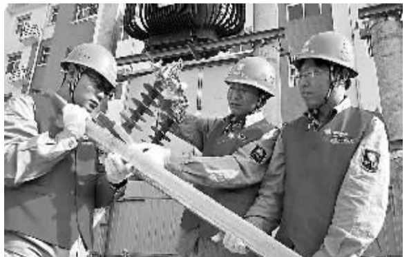
为服务中小企业发展,河北省河间供电公司今年专门开辟“绿色通道”,简化用电业务办理流程,为企业重点项目建设提供超前服务。图为6月29日该公司施工人员在河北巨龙线缆有限公司进行施工。

据了解,宁波供电公司推出“节电处方”,企业可按照生产计划向供电公司报出需求电量,超出部分另行计费。此方案平均可为当地小微企业减少近四分之一的电费。深圳供电局则通过协助企业开展节能改造降低企业电费支出。统计显示,改造后的27家小微企业去年累计节电1.3亿千瓦时。