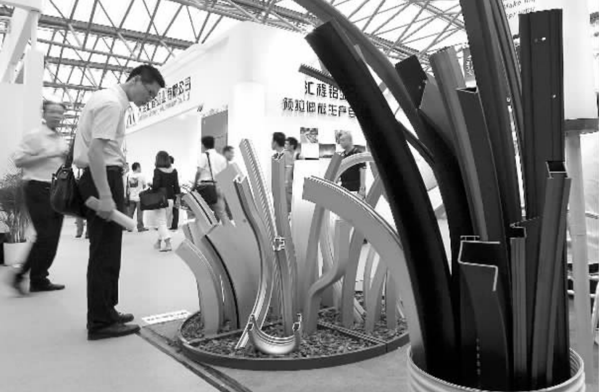
7月2日,观众在观看铝制品。当日,第九届中国国际铝工业展览会在上海开幕,来自全球30余个国家和地区的450家铝工业企业参展。此次展览展示包括原材料、半成品以及相关机械设备等在内的铝工业全产业链。