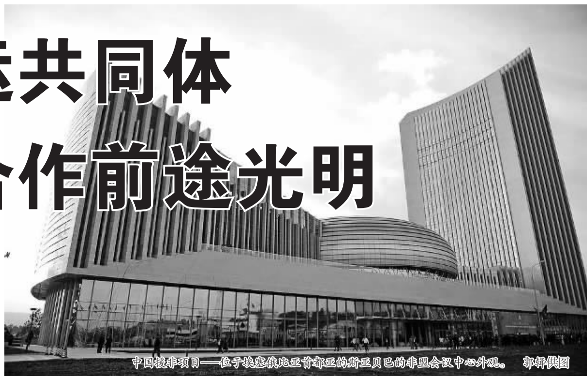
中国援非项目——位于埃塞俄比亚首都亚的斯亚贝巴的非盟会议中心外观。