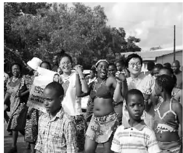
中国援非志愿者与当地居民共同庆祝博茨瓦纳国家语言节。

张永蓬也认为,对非援助不仅能够推动非洲发展,承担我国作为负责任大国应尽义务,而且对于拉动我国经济增长和增加就业具有直接意义。非洲发展起来对我国来说是好事。作为一支正在崛起的重要国际力量,非洲是值得信赖并可以借助的国际力量,可以缓解我国在国际关系中的压力,营造有利的国际环境。