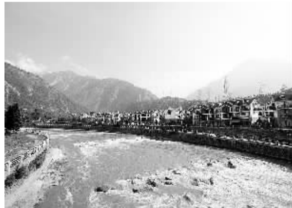
由安凯客车与中国旅游报社联合主办的主题活动“安凯美丽中国行”日前走进四川，走访了汶川地震后得到整体规划和重建的映秀镇...