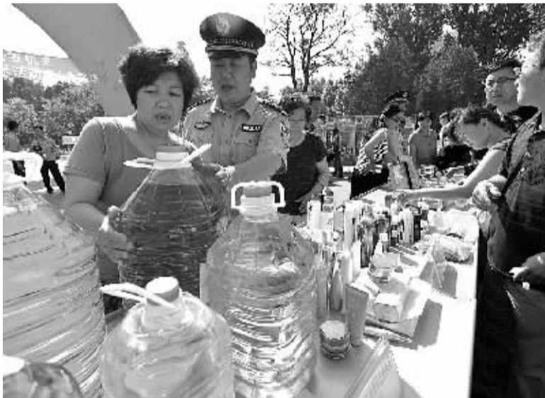
6月19日，河北省唐山市公安局民警在向市民讲解假冒食用油的鉴别方法。当日，按照公安部统一部署，全国36个城市同步开展了“打击食品犯罪保卫餐桌安全”成果集中展示活动。