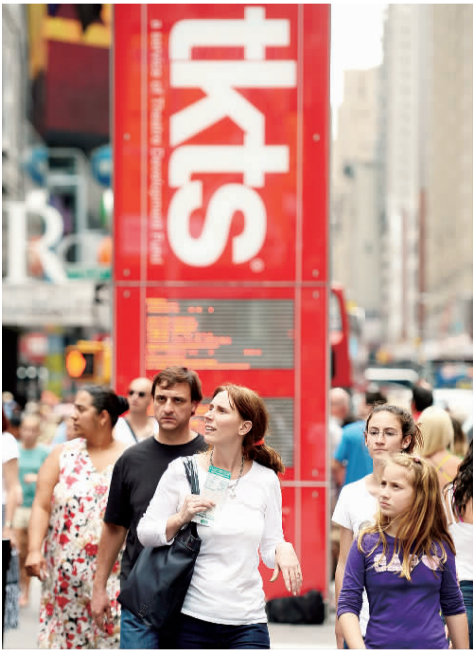
6月26日,游客在纽约时报广场的百老汇票亭前参观。26日,位于纽约时报广场中心地带的百老汇票亭TKTS进入第40个年头。TKTS由美国剧院发展基金会设立,专售百老汇当天演出的打折票。高达50%的折扣每天都吸引成百上千的人们排队求票,票亭40年来卖出的打折票累计约5850万张。

菲律宾的国民储蓄却相当不景气。据菲律宾央行最新调查数据显示,今年一季度,全国仅有24.5%的家庭有储蓄存款,二季度这个数据降至22.4%。央行调查显示,大部分菲律宾民众理财观念淡薄,习惯于寅吃卯粮式的超前消费。