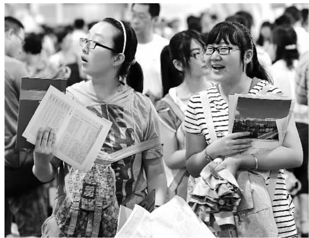
6月25日，江苏省2013年普通高校招生咨询会南京主会场在南京国际展览中心举行，全国270多所高校的招生人员及教育考试部门的代表与会，介绍招生信息、开展志愿填报指导。

据悉，全国海关在提高查验针对性的基础上，进一步加强毒情研判，全面加强缉毒工作力度，先后阻截了“金新月”、“金三角”毒品入境等多起重大毒品案件。海关还不断加强国际执法合作，由中国海关倡议发起的打击毒品走私全球联合行动“天网行动”，得到世界海关组织68个成员海关、5个地区情报联络办公室及国际刑警组织的积极响应。