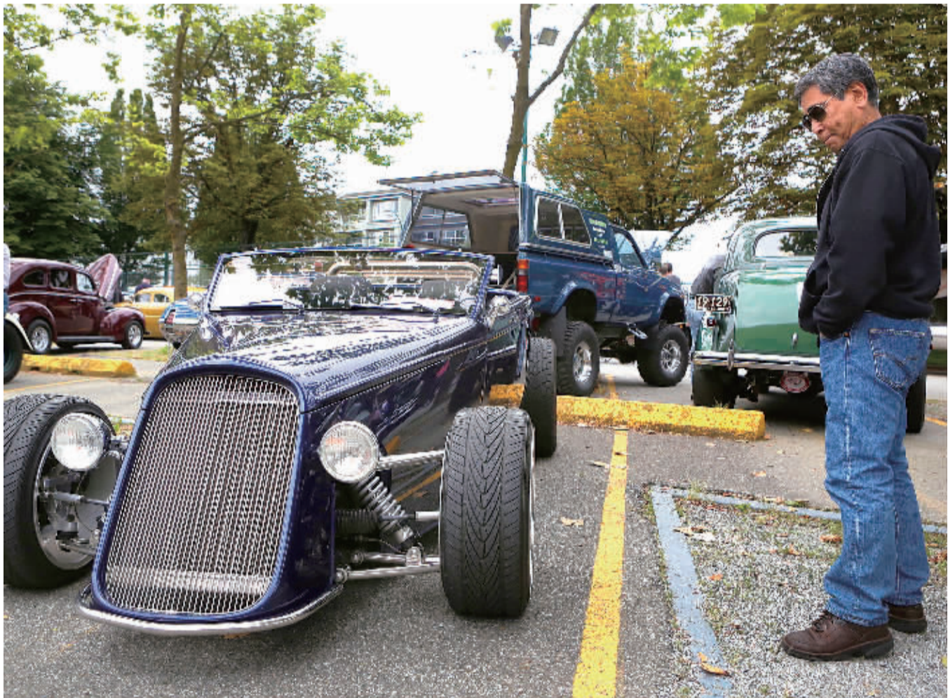
6月23日，在加拿大温哥华，一名男子在老爷车展销会上欣赏一辆别具特色的老爷车。当日，在温哥华太平洋展览馆举行的首届老爷车展销会吸引了大批民众关注。市民在展销会上除了可参观展出的500辆罕有老爷车之外，还可参与部分展品的公众拍卖。(新华社发)

按照计划，泰国政府将加大该地区铁路、高速公路、电力项目等基础设施建设的力度，挖掘经济发展潜力，同时积极促进该地区的招商引资。其面向国内外的招商引资产业及项目主要包括：以再生能源为主的电力产业、以畜牧业为主的农业、食品加工业、初级橡胶加工业、电子产品制造业、汽车零部件制造业、服务业和公共事业，大部分投资项目集中在呵叻府、孔敬府、乌隆府、乌汶府和武里南府等地。