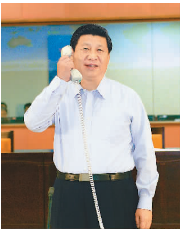
6月24日,中共中央总书记、国家主席、中央军委主席习近平来到北京航天飞行控制中心,同正在天宫一号执行任务的神舟十号航天员聂海胜、张晓光、王亚平亲切通话。

聂海胜:感谢习主席的关怀!我和晓光、亚平的身体状况都非常好,各项工作按计划进行。能够实现中华民族的航天梦想贡献力量,我们感到非常骄傲和自豪!